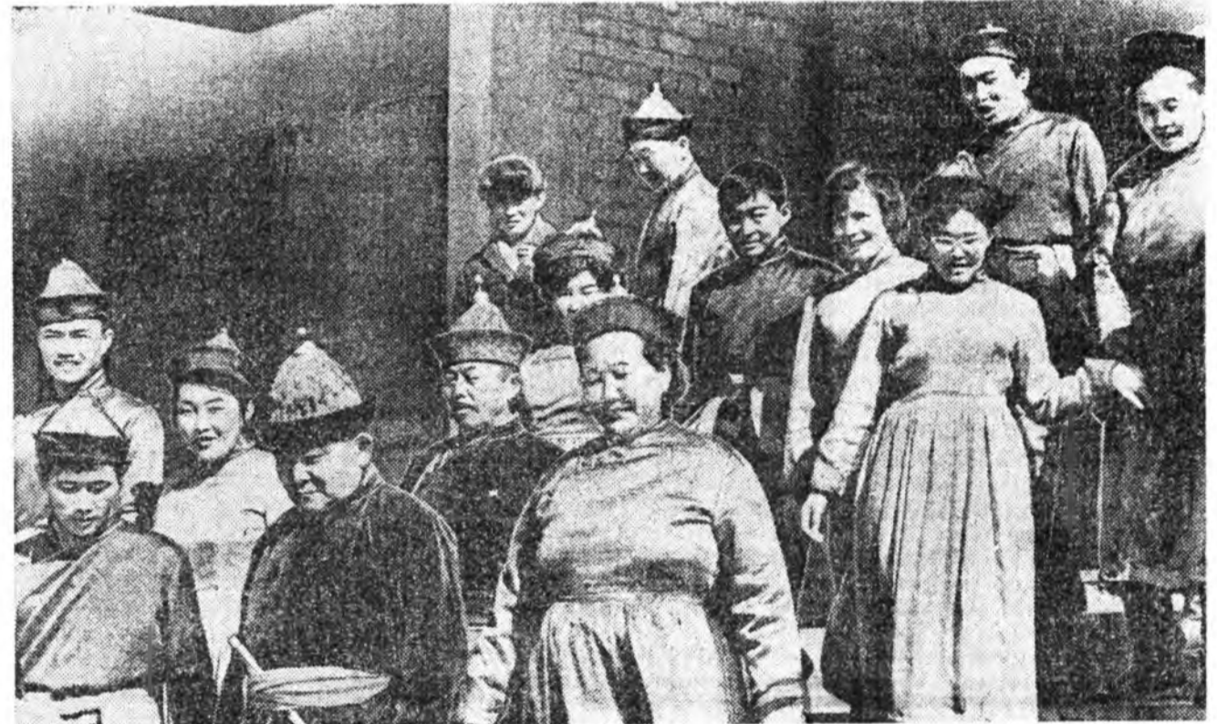
«Уулын оройгоор харахад», «Улаан Оронгийн» гоё гэсэнэй» гэжон дуунай аялга ямар найхан даа! ЗУРАГ ДЭЭРЭ: Улаан-Удын аймагай «Улаан Оронго» колхозой уран найханай бүлгэмэйхид.