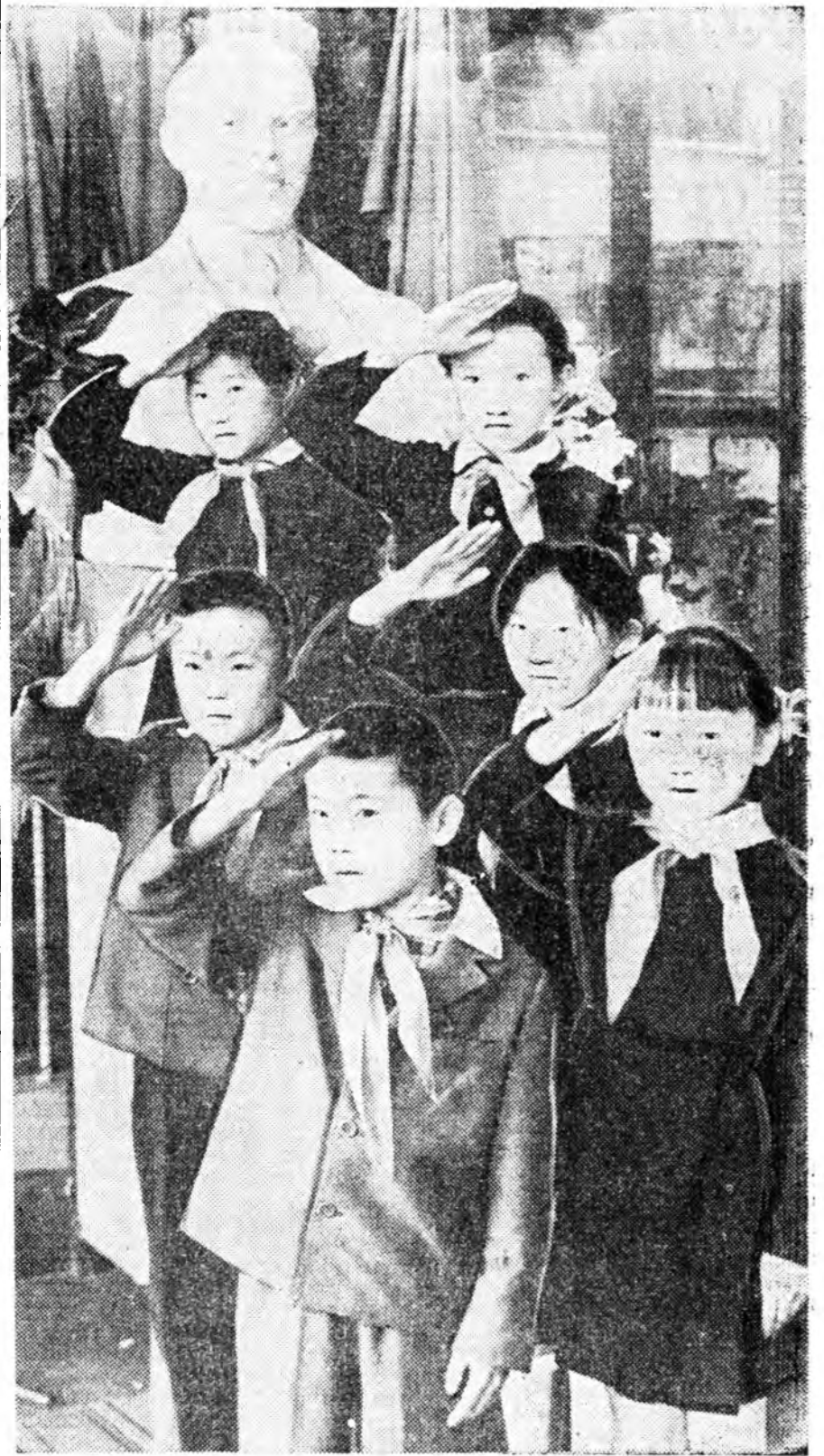
КОММУНИЗМЫН ХЭРЭГЭН ТҮЛӨӨ ТЭМСЭЛДЭ ХЭЗЭЭДЭ БЭЛЭН!