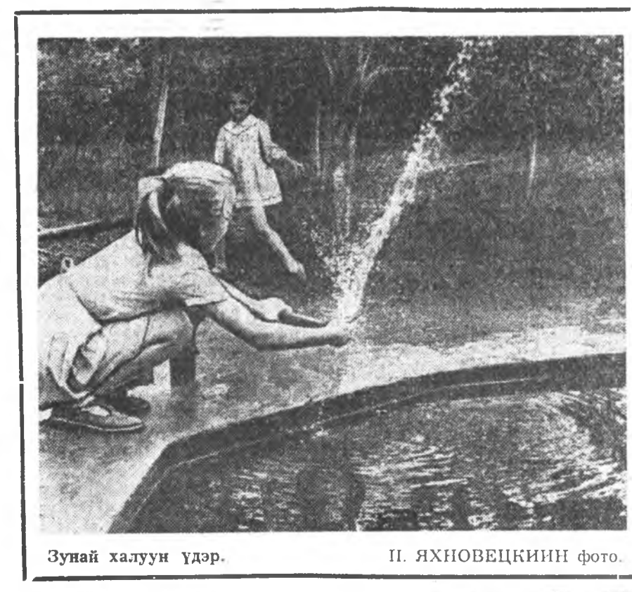
Зунай халуун үдэр.

Далай гүн бодолоо Даража ябангүй. Хүсэһэн сөбөр хүсэлөө Хүнөө иоунгүй; Ээрхэг эмниг долгидто Эмээлжэе табинам; Наранай туяа булзажа, Наадан ошоһын харанам; Нарай жаахан үхибүүд Наруулидань жаргана; Наһатай болонхон хүнүүд Нарияжажа номнижон; Оюун түрэнэн эдлээб; Оёор хүрэтэрн эдлээб; Толи торгон мэдэрэлээ Томодожол хуурайб.