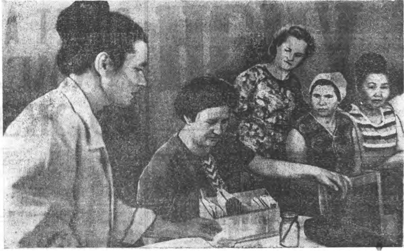
Улаан-Удэ городской медицинн хүдэлмэрилэгшэд хирэ хирэ болоод...