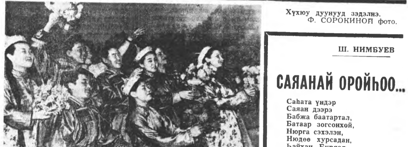
Хүхюу дуунууд ээдлэнэ.

ЭБТЭЙ, ЭБТЭЙ совет арадууай бүтэ соо Бураад оройнойнай үүхэтэ 45 жэлэй туршада туйлан, амжахан, илахан юумень дурсаха, тоолохо болоо наа, урлаа ортогшуй олон, захдаа гарташгүй үргэн даа. Хүн бүхэн Эхэ оройнойгоо илалта, дэбжэлтээр баясана, омогорхоно.