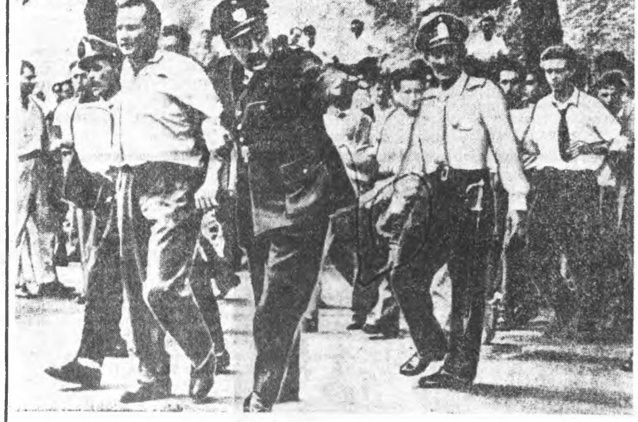
Уругвайн ажалшад өөһдөнгө эрхын түлөө зоримгойгоор тэмсэе. Хүдэлмэршэд, студентүүдэй забастовконууд— бүхы орон дотор боложо байна. Юумэнэй үнэ сэнгэй хүндэрхэнэй хүлүүдэр са- баадаһан хүдэлмэршэд, студентизрыс түрмэдэ хаана. ЗУРАГ ДЭЭРЭ: Монтевидео хотын ажалшаддэ демонстрацида хабаадагыс баряад туужа ябана.

Бонной Вашингтоной хоорондох сэрэгэй-политическэ хэлсэе барисае бэхжүүлэхэ гэдэн хүсэлэгтэй Европод аюулгүй байдал хангаха асуудлые улам түбэгтэй болгоно, тингээхэ ФРГ-гай хүрнэ буудад түрүүлгэ ханаатай байжа шадахагүй.