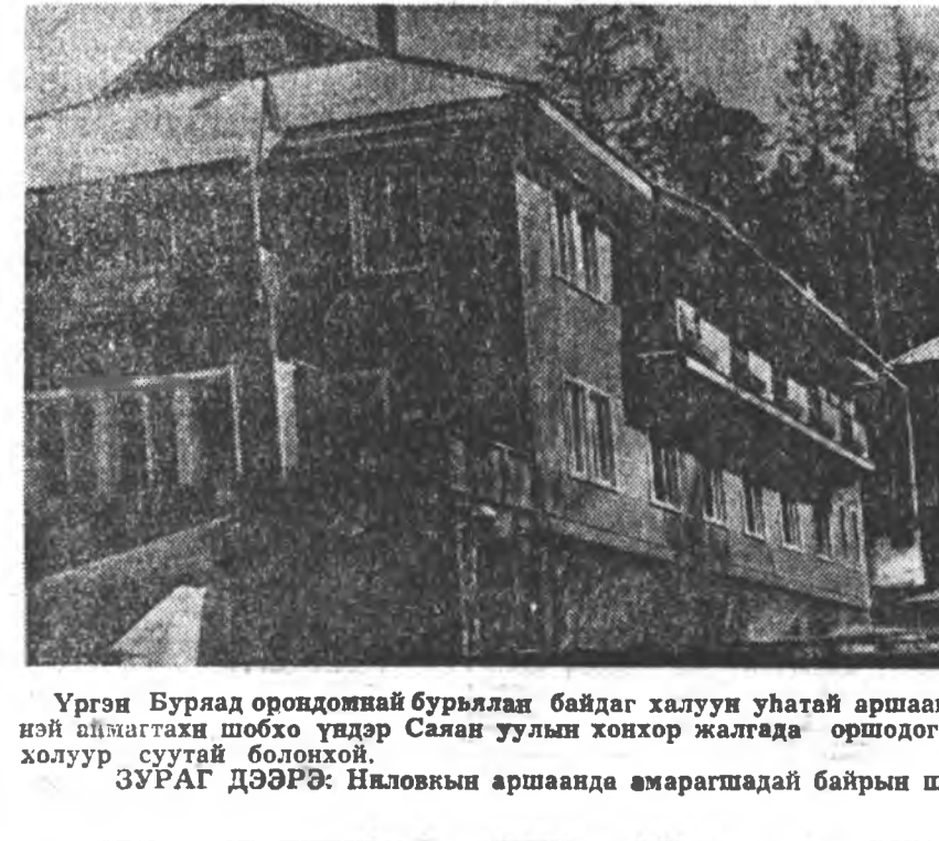
Ургэн Буряад орондой бурьян байдаг халуун уһатай аршаанууд олон. Тэдэнэй нэгэн—Түхээнэй аймагтахи шобхо үндэр Саян уулын хонхор жалгада оршодог Нилыкын халуун уһатай аршаан—холуур суугай болонхой. ЗУРАГ ДЭЭРЭ: Нилыкын аршаанда амаргашадай байрын шэнэ гэрнүүд.

ГРОССЕТО. Москва шадарей иженер, СССР-эй рекордмен Эдуард Гушин Италийн энэ хотодо унгаргадэһэн уласхоорондын мүрысөөнүүдтэ Европын чемпион Вильмош Варью (Венгри) гогшые ядро түхилгөөр илаһан байна. Эдуард Гушинэй ядро 19 метр 6 сантиметртэ татагдан зурлаагай саана унаа. Тинхэдэ Варью гогшэ Гушинһаа 26 сантиметрээр «гөгддээ».