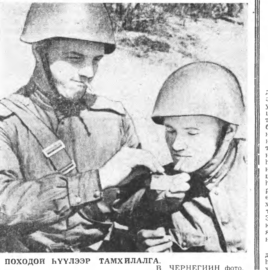
ПОХОДОЙ БҮҮЛЭЭР ТАМХИЛАЛГА. В. ЧЕРНЕГИНН ФЕТО.