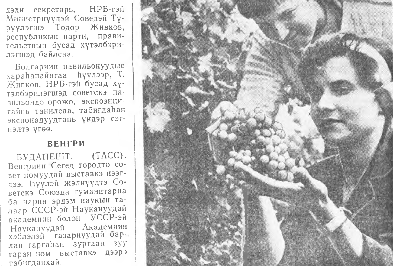
Венгри саадуудай, виноградингуудай, овоочой ажахуудай орон юм. Эдэний тарилгын талмай үргэдхэг, ургасмынь дээшлүүлгэ Венгрин овоц, үрэ жэмэс, консервэ ондоо оронуудта худалдалгы үргэдхэгдэн тулалда. Имэ зүйлүүд дэлхэйн хори гаран орондо худалдагдадаг. Советскэ Союз эгээн лэ эхээр эдэни худалдажа абадаг юм. Зураг дээр: Будапешт шадарай «Сэнхир Дунай» гэж хүдоо ажахын кооперативай плантанууд дээрэ столовын угааг хайн виноград эдэсшээ.