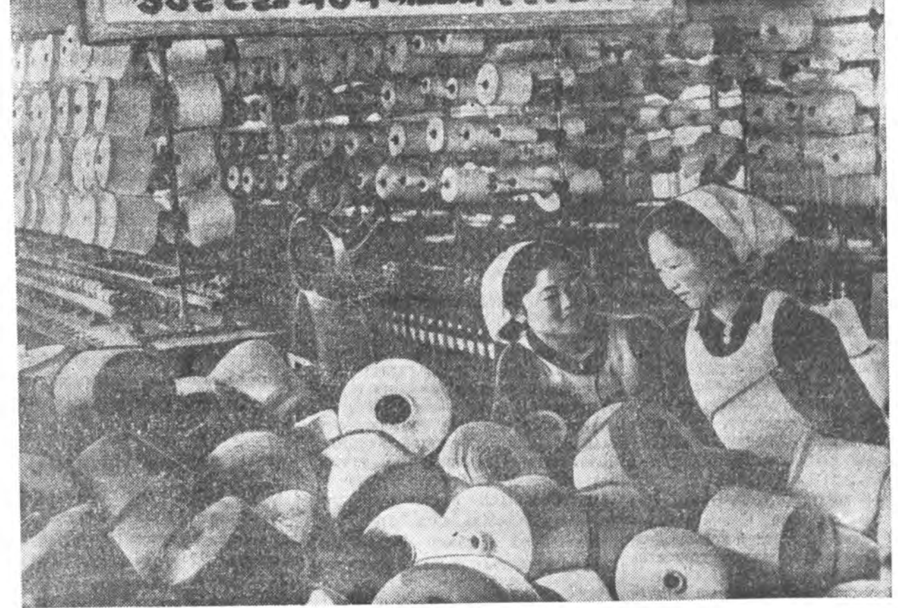
Арадай засагай тогтоон жэлүүдээ хошино КНДР-тэ буд нхэлгын промшлшность эхээр хүтжөө. Олонхи томо предпритиундунь мүнөө үе сагай машинаудад хангаданхай. Зураг дээр: Пхеньянд буд нхэлгын фабрикын пехүүдэй үгэн соо.

Хуралдааныг зохионо. Хуралдааныг зохионо. Хуралдааныг зохионо. Хуралдааныг зохионо. Хуралдааныг зохионо. Хуралдааныг зохионо.