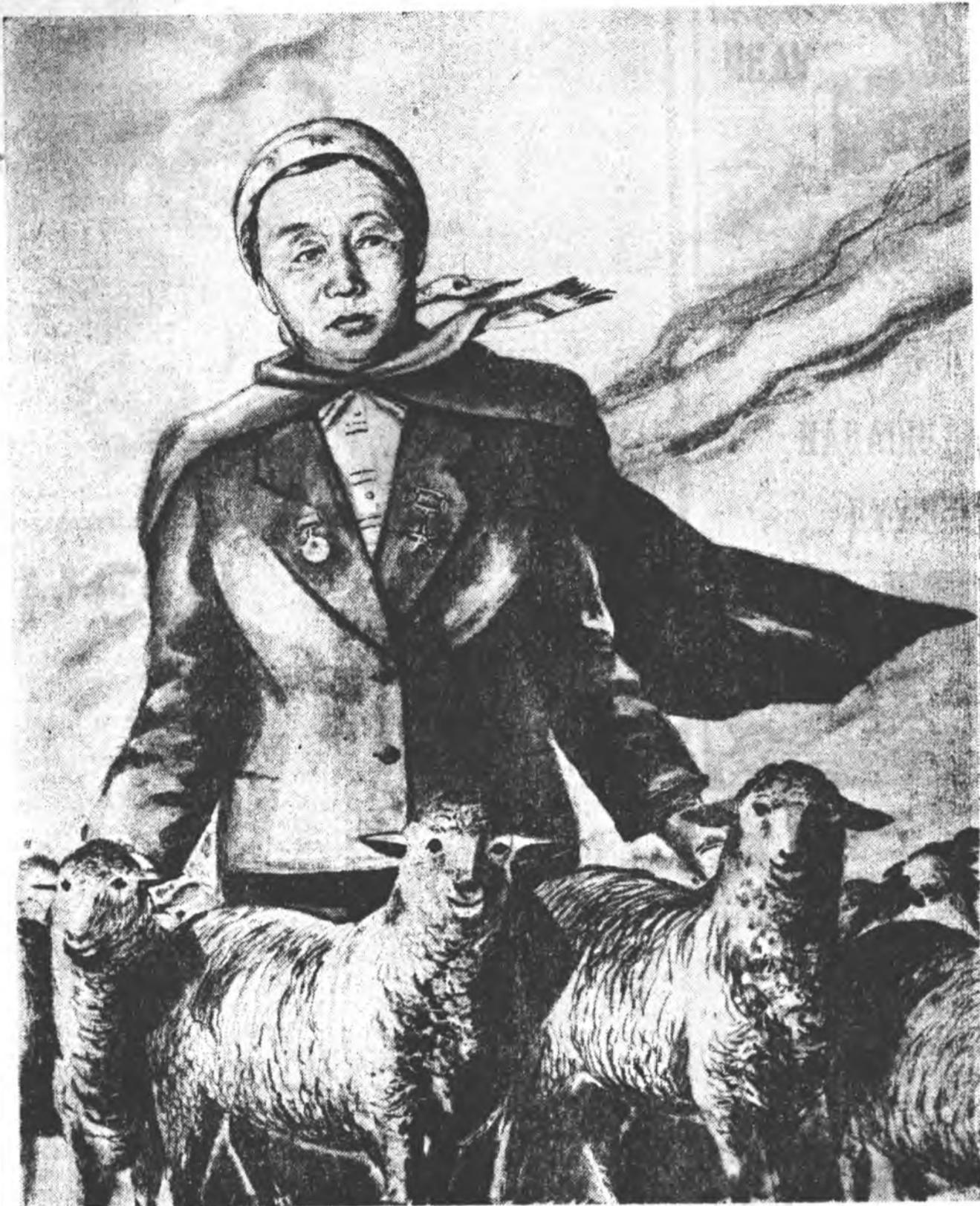
Бага эмээхилһэн урин дулаан шарайтай, үбсүүндэ Алтан Олон медаль, Ленинэй орден ялруулан бүхнү эмээхилһэн Буряад ороноймнай хүн зон үбгэн залуугүй таниха, мэдхэ байха.

Хүдөө ажахын үйлдэринь эрдэмтэй болгохо, ажалтай манай республикын ажахьнуудта эхэ шалгалта болохо. Үбһэ тэжээлэ зүбөөр, ашаг үрэ эхэтэйгээр гаргалха, малшад ажал онгоножоруулха хэрэгтэй.