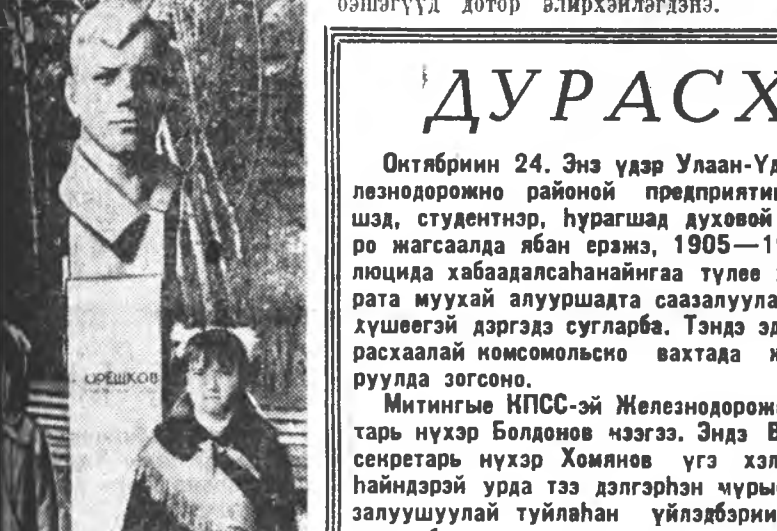
Энэ үеэр Улаан-Удэ... Комсомолой бүхэсэюзна...