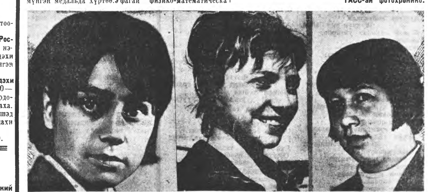
Энэ үдэр манай велосипедистнуудай команд байла...