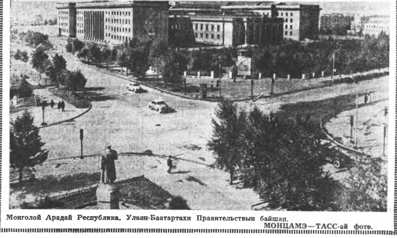
Монголой Ардай Республика. Улаан-Баатартахи Правительствын байшан.

— Митингын зүрхэ хүдэлгэмэ минута зүгтэ эхилнэ. ВЛКСМ-эй ЦК-гай нэгдэхэ секретарь Е. М. Тяжелыков ВЛКСМ-эй 50 жэлэй ойдо зориулалта Москвагай болон Москвитин областин залуушудтай баяр ёһололой митинг дүүрэн дээрэ тоологдон.