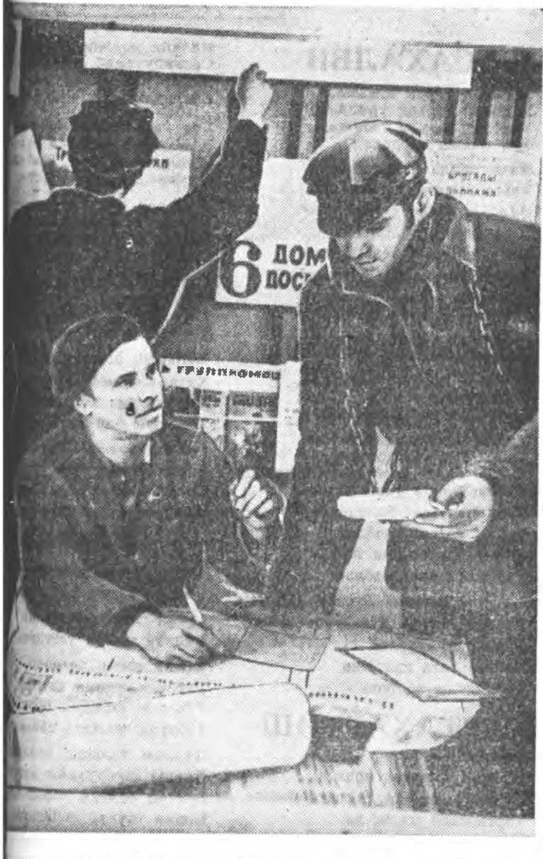
«Хойто зүгэй толон» гэж газаровод Коми АССР-эй газар дээрхээ эхи абана. Ингэжэ ороонийнай баруун хизаарнууд үнэгүй түлшхэтэй болохон.