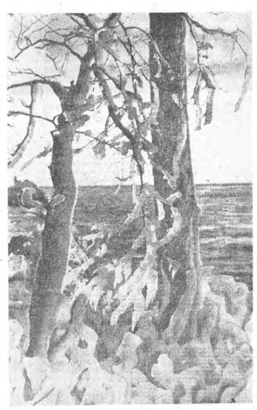
БАНГАЛАЙ ЭРЬБЭДЭ. Ноябрь бара.