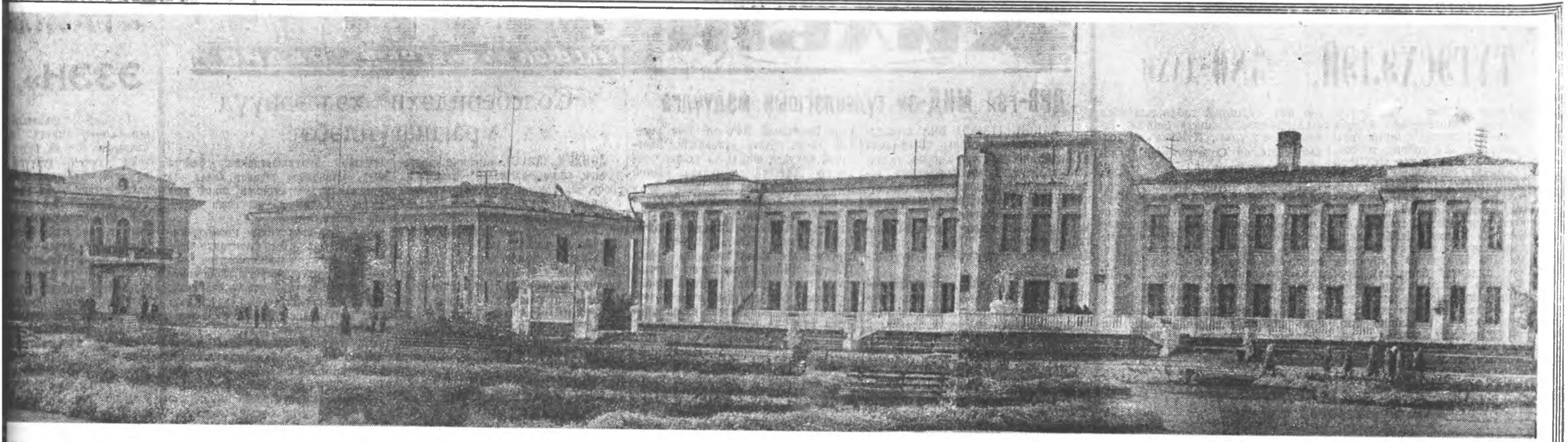
Мүнөөнэй Шушенск хот урдын сагайхнаа тэд ондоо болонхой. Унахаа байхан үжхи гэрнүүдэй орондоо хөдөө ажахын районий томо түб, мүнөө үеын хүдэлмэришнэй тосгон урган бодоо. В. И. Лениний түрээр 100 жэлэй ойдо зориулагдажа, шэнэ хото эндэ баригдажа эхилэхэй. Зураг дээр: Шушенскийн түб талмай.