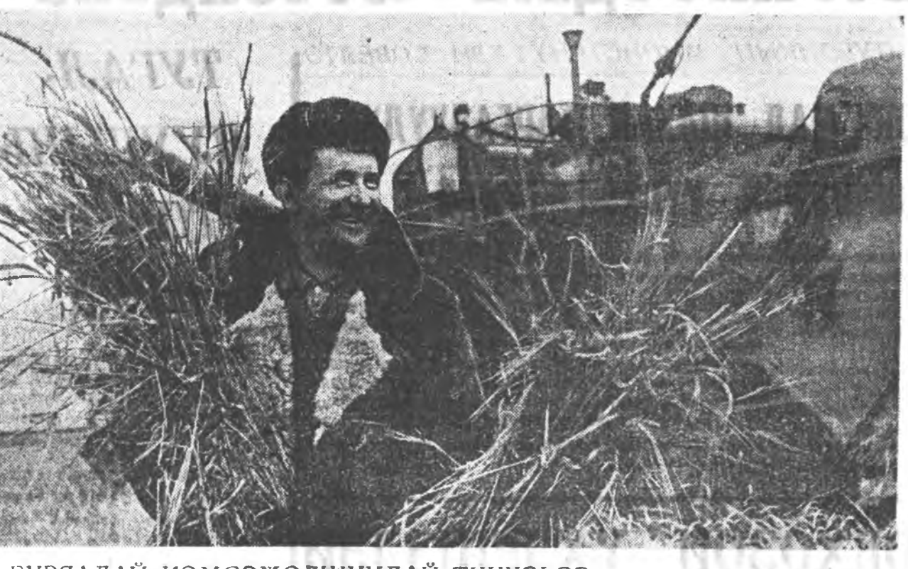
БУРЯАДАЙ КОМСОМОЛШУУДАЙ ТҮҮХЭНЭЭ