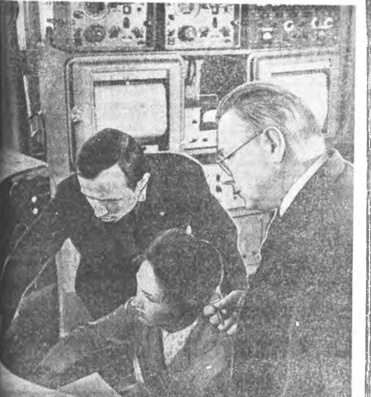
МОСКВА. Нара шэнжэлхэ шэнэ олол аргануудыг олол радиотехник В. В. Виткевичтэ нэрэ олодо мэдээж болохой.