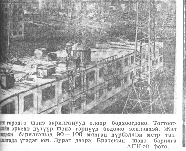
Һамаура шэнэ барилганууд олоор бодохоодо. Тогтоогшын эрьедэ дутүүр шэнэ гэрнүүд боджо эхилһэнэй. Жэлэй барилгашад 90—100 мянган дүрбэлжэн метр талдалада үгэдэг юм. Зураг дээрэ: Братскын шэнэ барилга