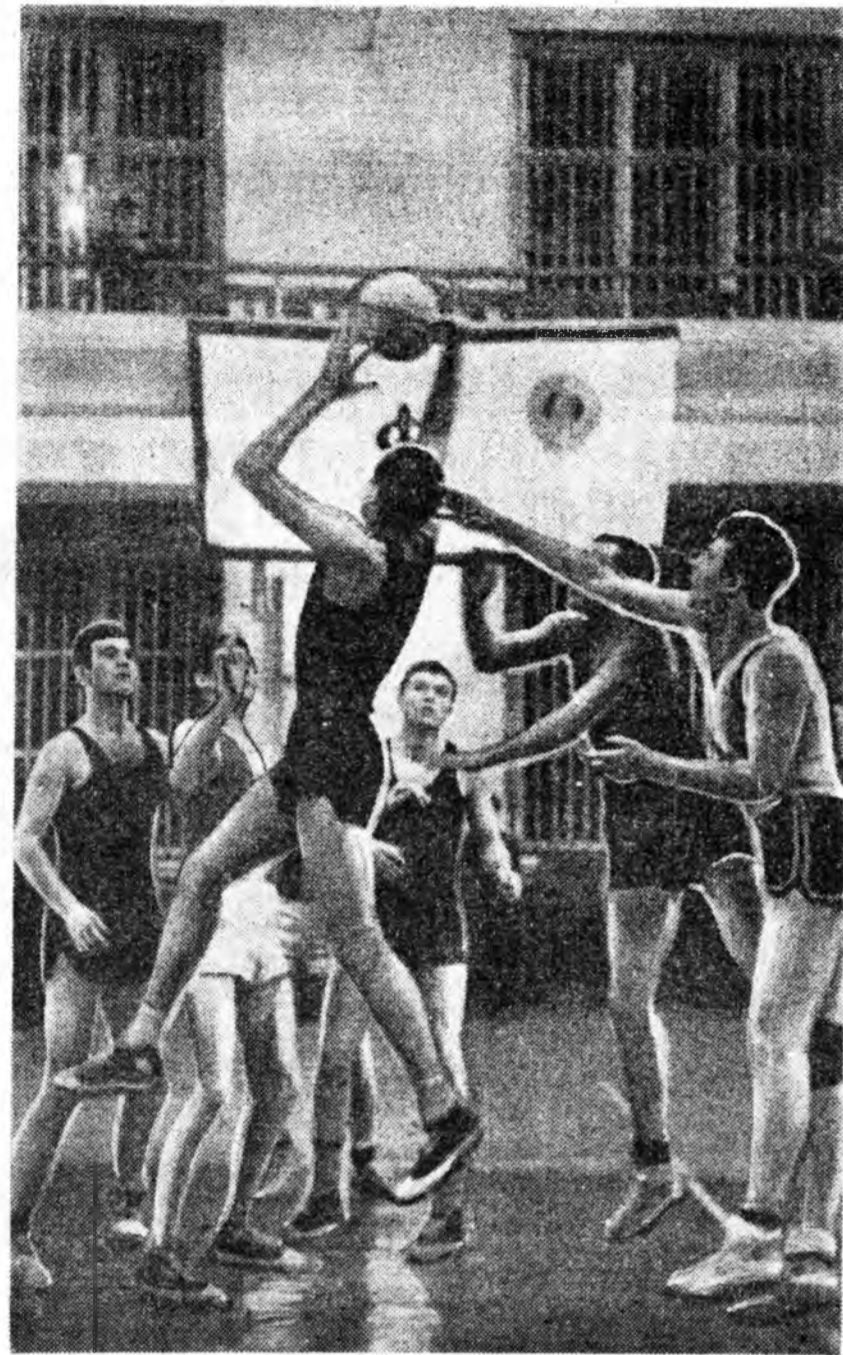
Баяхан Улаан-Удэдэ, спортан ордон соо Шэтэ, Улаан-Удэ хотонуудай баскетболистуудай уулзалга үнгэрэгдэбэ. Энэ мурисөөндэ Улаан-Удын эршүүдэй команда иласта туһалан байна. ЗУРАГ ДЭЭРЭ: Улаан-удынхидэй довтолгын үгэ харуулагдана.