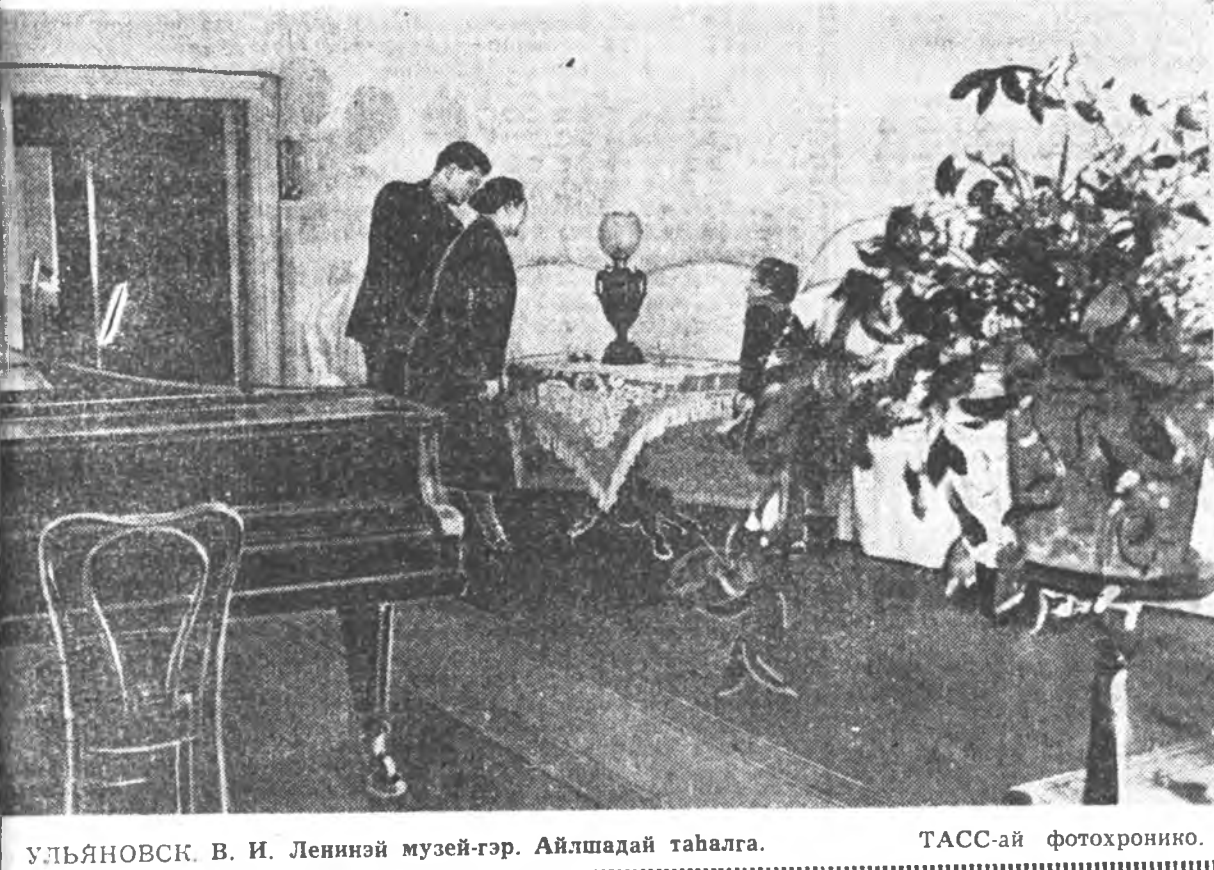
УЛЬЯНОВСК. В. И. Ленинэй музей-гэр. Айлашадй табалга. ТАСС-ай фотохронико.

эрэе хүбөөнь, сэнхир сэгээн уһан долгинеь шэртэн байтар, Ильич дэй мөшөөһөн урин нудэн үзэг- дэбэ гү гэхээр. Тосхойноо зүүн уршажа нагай ой хузар ороһодо, мүнөө заловедник болгоһон 600 гектар үрэн ой ороһон нэмжэһэн. Тэрэнэй дунда ороһон бурзаа хаалагданхай Перово нуур нула- на, гадуудаа үлдэн амаржа ор- шоно. Тэндэй отгой дэргэдэ хүз зон баһал олон. Мининиһе нүхэдэ — Цырен Илья хоёр — тараагагүй. Экскурсоводой хөөрхэе шагна- бади. — Энэгүүр Владимир Ильич агнаха, амарха дуратай байгаа. Удэһэ, үлгөөгүй бүү үргэлһэн, түргэн гэнхэдэлтэй Ульяновыне нотгай гаряшад аһала хардаг һэн... Эгээл энэ Илья Цырен хоёртой һүбөлгөн ухагаа, холыне харһын бодол гүйлгэдэг байһанынь лэч- лаггүй. (Ургэлжэлһыне хожом гараха).