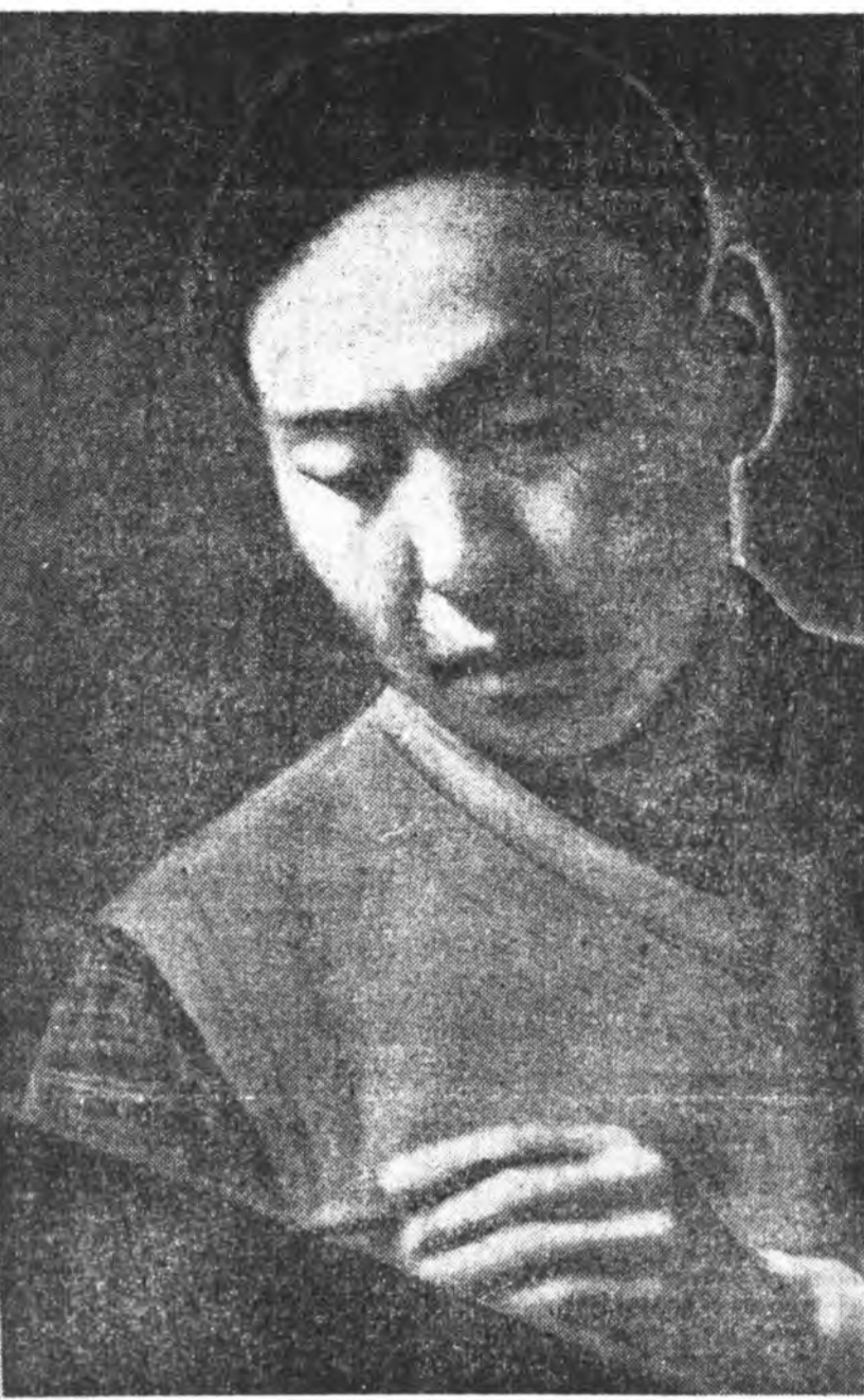
ЗУРАГ ДЭЭРЭ: К. ДУЛЬБЕЕВ.