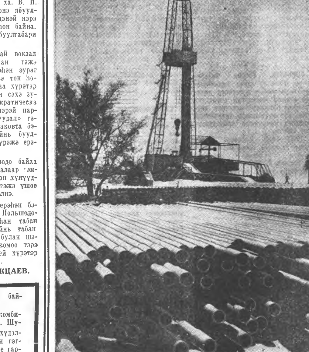
СССР Пакистан хоёрой хоорондохн экономика, техническэ харилсаан жэлдэ жэл бүхэндэ бэхжэжэ. Совет, пакистан нефтьлэд эхэ амжалта туйлаа: Кот Саранг. Тутэ гэнэн газарнуудта нефтин хэбтээ олонхой. Ингэжэ пакиста-найхид өөһадын нефтьгй болоо. ЗУРАГ ДЭЭРЭ: «Тус-1» гэнэн нефтин хэбтээ. Эндэ сүүдхэ-дээ 200 тонно нефть абтана.