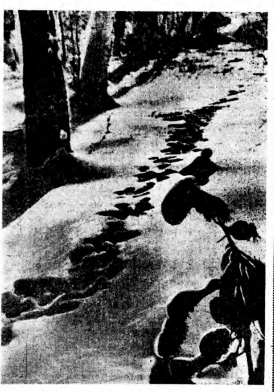
Убэлэй ой соо. Шандаганай мурнууд.