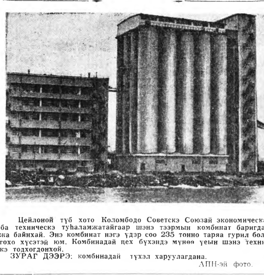
Цейлоной түб хото Коломбодо Советскэ Союзай экономическа ба техникческэ тунагаймайтар шэнэ тээрмын комбинат баригдажа байхэй. Энэ комбинат нэгэ үдэр соо 235 тонно тарья гурил болгохо хүсэтэй юм. Комбинат лех бүхэндэ мүнөө үеын шэнэ техникэ тодоходонхой. ЗУРАГ ДЭЭРЭ: комбинатда түхэл харуулагдана.

Лейборис правительство Баруун Германиятай дүтин барисаатай болоха эрмэлздэг байшааа НАТО дотор харуулаа гээд мэдүүлгэ соо заагданхай. Хүйтэн дай нүжэрөөхэ зорилгоор НАТО-гой абажа байхан хэмжээг абулгануудта НАТО гэжэ эзэрхэг түрмэхий бүтээлгэше усалхаа, ФРГ-гай амьшье татаха, Европотохи аюулгүй байдал хангаха ёһотой эмх байгуулаха зорилготой оролдосотой шингэ тэмсэл харуу боложо үгэхэ ёһотой гээд Голлан онсолон тэмдэглээ. Коммунист ба худалбаршээдэй партинуудай түлөөлгшнэй энэ жэлдэй майда болохо улаасхоорондын зүбшэн империализмтай хэхэ нийтэ тэмсэлдэ нэгдэхэдэ аюулаа хангаха хэрэгтэ угаа өхэ улха шаартай байлохо юм.