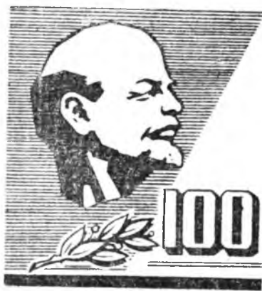
(Түгсэхэд, Эхнинийн 3-дахин нурт).

гон соо солдадууд шэглэсөөд байба. Нууха аргагүй дээрхээ бүх замаа хүл дээрээ байж үнгэр-