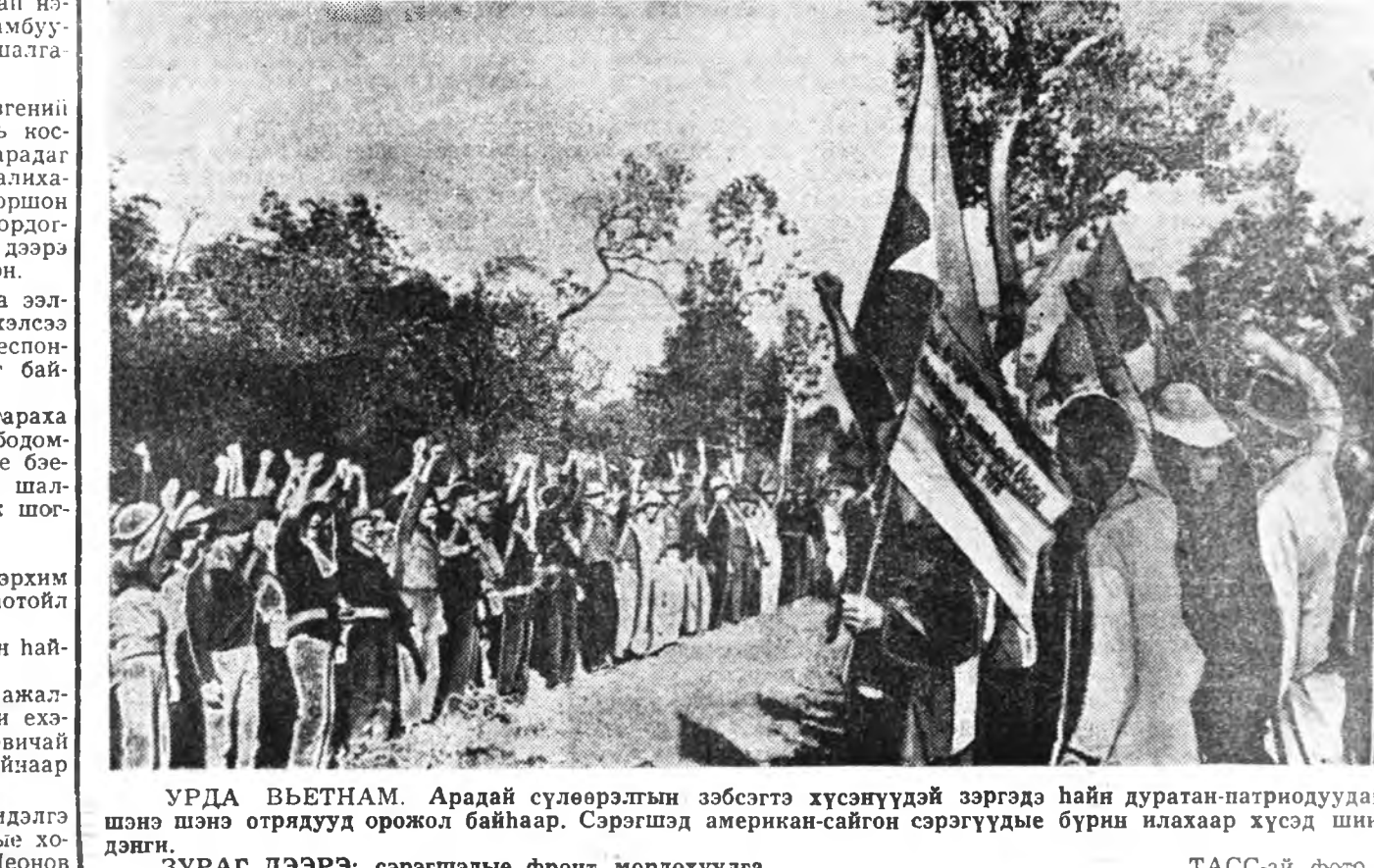
УРДА ВЬЕТНАМ. Арадай сүлөөрэлтын зэбсэгтэ хүсэнуудэй зэргэдэ найн дуртан-патриотуудай шэнэ шэнэ отрядууд орожол байнаар. Сэргэгдэ американ-сайгон сэргүүдыне бүрнэ илахаар хүсэд шиндэнг. ЗУРАГ ДЭЭРЭ: сэргээдыне фронт мордохуулга.

Космонавтуудыне найнаар хара-хын тула ракетэһэе холодоно. Нилдэлгын урда тээхи бэлэн болгодоһоной 2 час сонсохгодобо. СССР-эй лэтичнэ-космонавт врач Борис Борисович Егоровто теле-журналистүүд хандажа, «Союз-5» онгосын экипаж тухай нэгэ хэды үгэнүүдыне хэлэхыне гуйбад. — Миний нэрэтын бэньнэ хайн, онгосохоо найн мэдэхэ. Егоров нэгэ хонирхолтой ушар наануула: зам-буулиной дайдыне шэнжэлэгшэдэй коллективтэ ерээхэдэ эгээл түрүү-хүүд уулзалан хүнине Вольногэ байхан юм. Борис Борисович Хру-нов тухай магтаалы үгэнүүдыне хэлэхэ, харин Елисеев бэрхэ мате-матик юм гэжэ тордохойло. «Волода Шаталовай нилдэгэ шэнги Вольнов, Елисеев, Хрунов гэгээдэй нилдэгэ мүн лэ амжа-лтатайгаар үнэгэрхэ гэжэ ханаба, — гэжэ Борис Егоров хэлээдэнхэ. Тэдэнэй бэын махабад тухай хэлэхэ болоо хаа, эрхим найн. Замбуулиной дайдада тэднэр ядад-хагуй байха. Энэ үедэ космонавтуудай бай-хан талмай телекамеранууд харуу-лаа. Тэднэр малгайнуулаараа, мүн толгой дээрэ гарнуудаа үргэ-жэ, тэдэнине үдэшгээд эрһэн хү-нүүдтэ баярыне хүрэнэ. Нэгэ хэдэн сагай үнэгэрхэдэ, нилдэлгын талмай дээрээ булта ябахана. Онгосын нилдэтэр нэгэ хэдхэн минута үлээб. Манай эр-дэмтэди, конструкторнуудай, худалмэришэдэй гараар бүтээгдэнэн хүсэтэ ракетэ ба замбуулиной онгос-оо холоһоо толотон харагдана. Нилдэлгын урда тээхи табан ми-