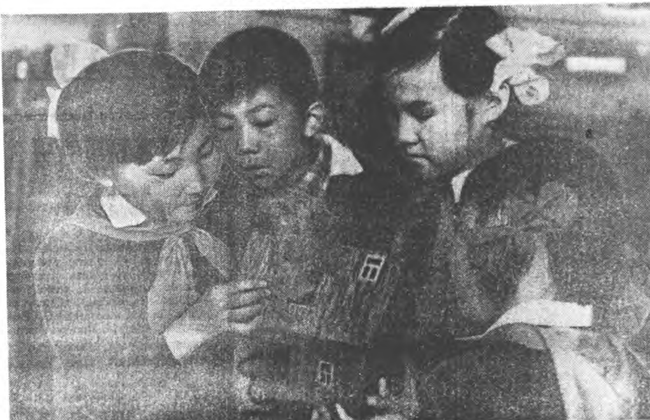
1917 ондо шоль харын үйлэ хэрэгүүдэй хүүдээр В.И. Ленин Саг зуурин правительствин мүрдэлгөөн тэрээдэжэ, бээ ноуха баатай болоо лэн. Июлин хорин габанай хүн Ильич Петрограднан гаража, Разлив станци эрээ лэн. Паршин ЦК-гай даабарар үнэн сэхэ хүмүүд өждишэ Разлив хүрэтэр үдэшөө. Станци шадарай тосхондо хүдэлмэрийн Емельянов-танай сарай чердак дээрэ хоргодожо хэбэ хоноод, хүүдэнь Разлив нуурай саада бээдэ үбшэнэй отог соо хүйтэн болотор байлаа.

Манай кружогой хүдэлмэридэ эдир бэшээндээ, фольклористууднаа гадна эдир уран зураашад хабаададаг. Тэдэнэр уншанан номуудтаа оорынхээрээ зурагууды хэдэг гэшэ. Мүн баһа гар бэшэмэт журналыоннай шэмэглэдэг, таабаринуудай тайлбаринууды зурагуудаар харуулдаг юм. Тингэжэ хүдэлжээ, эдир уран зураашин шадабари мүлгидэдэг, нүдэниинь хурса болодог ха юм.