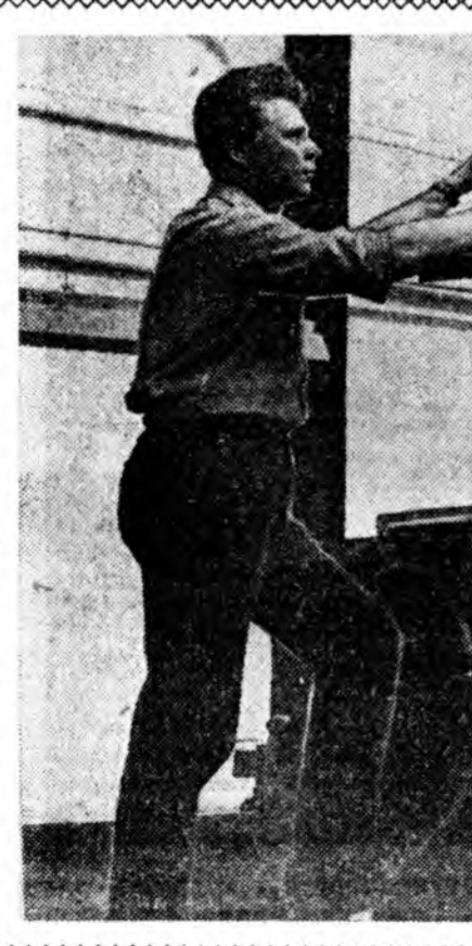
Урдын, бүри дайнишье урда... тээ, ажахыманай адуун нүрэг... олон һон. Тээд нундшьеб даа...