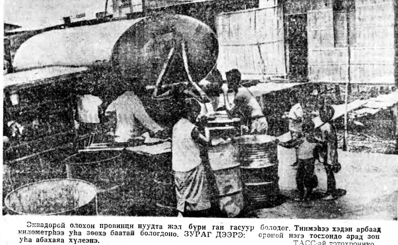
Экваторой олошон провинци нуудта жэл бури ган гасуур болодог. Тиммээр хэдэн арбаад километрээ уна зөөжэ баатар болодоно. ЗУРАГ ДЭЭРЭ: оройной нэгэ тосгондоо арад энэ