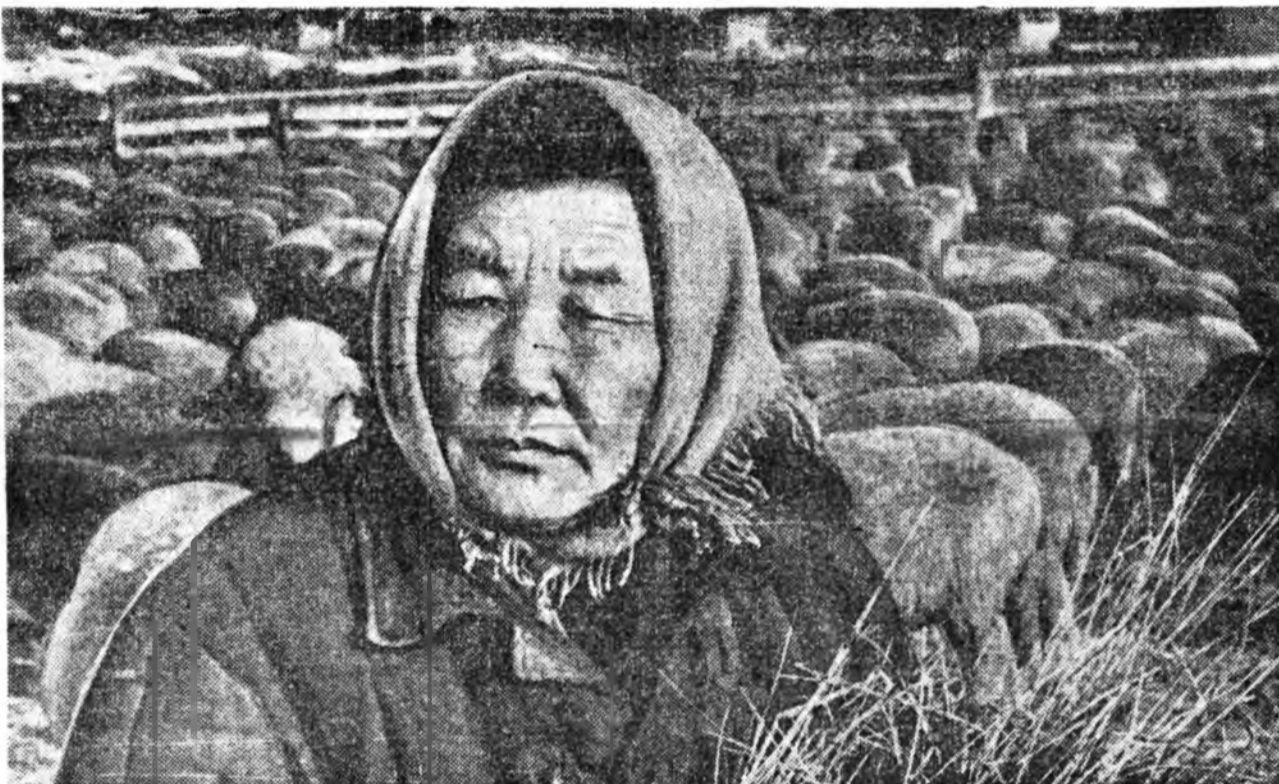
ЗУРАГ ДЭЭРЭ: Эдын аймагай «Коммунизм» колхозой түрүү хонидхоо нэгэн Ж. Т. Чимтгова.

Л. МИНЕЕВ, совхозой парткомой секретарь.