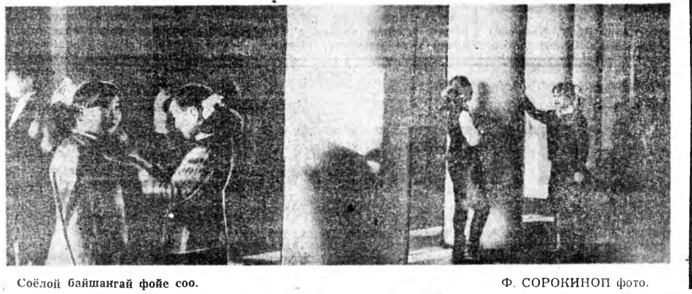
Соёлой байшангай фойе сөө.

Зүүр арбаад жэлэй саада тээ өрнүн болонца, хуугадай саад, гостиница энгэмнэй үгэ хэн. Тинхэлэ хүнөө?.. Негропартовца тавин харгылаха болбод, энгээ элдэе тулгуулаха аргатай болбодби. Хэрбээ арбаад жэлэй саада тээ өлөн үхүбүүтэй гэрэй эзэн эхлээр нийтэн ажалтэ абадхаха аргагүй наа, харин мүнөө үхүбүүдэ саадаг үбэгэ, наһа амархан худалдаа аргатай гээшэ.