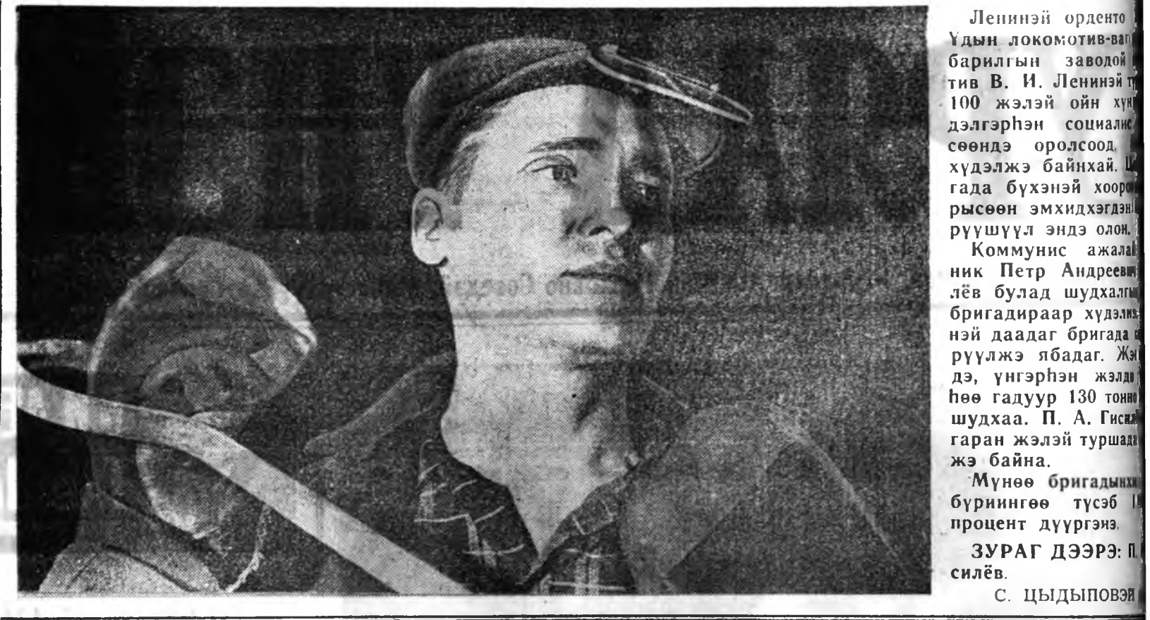
КПСС-эй ЦК-гай октябриин Пленумэй шийдхэбэринүүдыё хүсэндэнь хуу...

В. И. Ленинэй түрлөөр 100 жэлэй ойе нэрэтэй түрэтэйгөөр угтадын түлөө дэлгэрэн социализм мурьсөөн хал хаангүй үргэлжэ. Хүдөө ажалай техническэ мэрээлэл ородог Тунхэнэй училищын хурагшад болон багшанар мүн лэ энэ мурьсөөндэ хабаалдажа, ехэ-хэн хүдэлмэри ябуулжа байһай. Эндэ училищын хурагшадэй хүсөөр В. И. Ленинэй булан Бич болгодоо, тэг байханаар шэжэлэн фотомонтаж болон альбомууд хэсдэ. Илхичэй ажабайтал ба ажал ябуулга тухай хоёрдөхөндүг үнгэрэгдэжэ, хурагшадэй анхарал татана. Гадна эржм болон техникын туйластануудыё, үйлдэбэрин түүнүүдэй дүй дүршэл шудалха, хуралсалгай ба соёлой хүдэлмэри байжаруулха хэмжээ ябуулганууд абаһа, хурагшадэй дунда мурьсөөн эмхидхэгдэ. Училищын багшанар хурагшад ба коммунис ёһоор хүмүүжүүлжэ, хүдөө ажалын шадамар бэрхэ мэргэжэлтэд болгохын тула хүсэ шадалаа гамангүйгэй ажаллана. Нүүдэй табан жэлэй турша соо 650 хүн хүдөө ажалын техническэ мэргэжэлтэдэй тооло орожо, аймагшанга колхоз, совхозуудта урэгшадтай найнаар ажаллажа байһай. Энэ училищид туйлагдаһан хүдэлмэринийн хайн үрэ дүгүүд мүн лэ агууехэ ойдо зорюулагдана. Ш. БАЙМИНОВ.