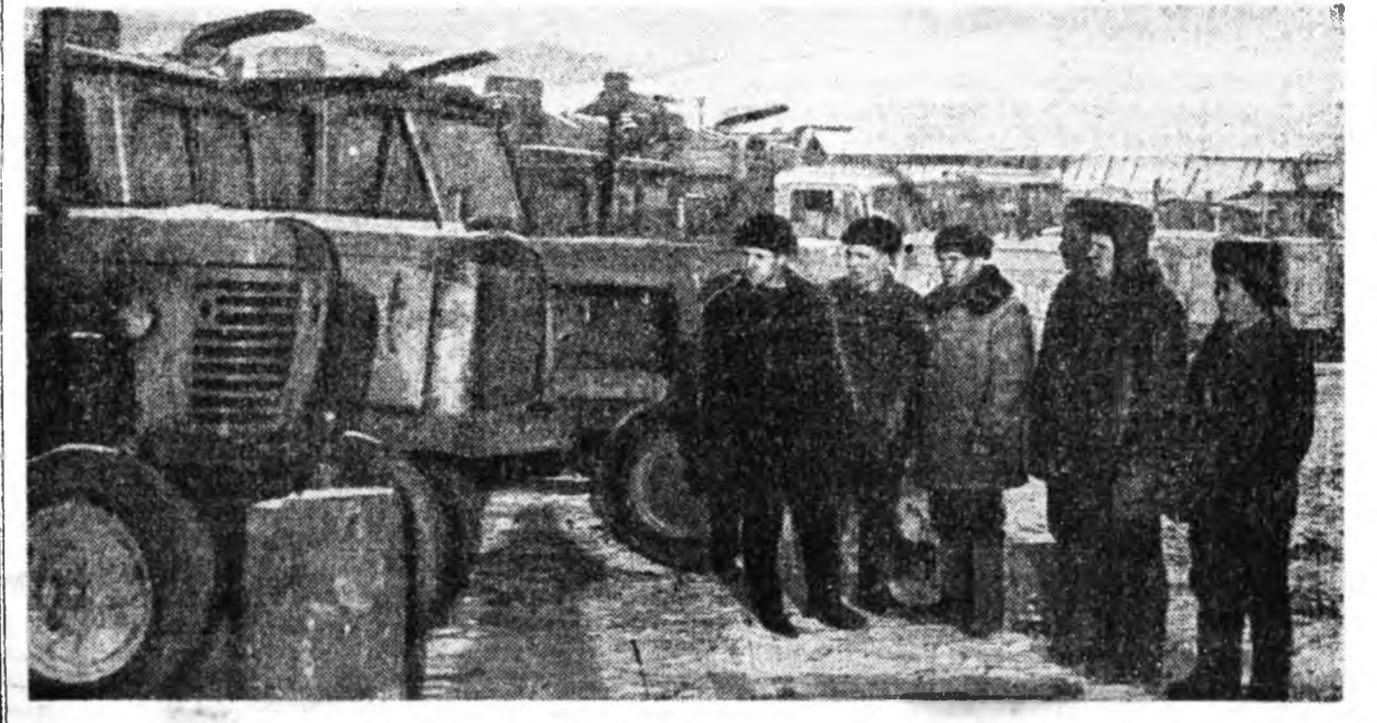
Эдэ үдэрнүүдэ Бшүүрэй аймгай Налининой нэрэмжэтэ колхозойхид хабарынгаа тарилгада түлэг бэлдэжэ байна. Бүхи үрлээ хүрэнгэнэ үшөө намар байхада сэлбэрлэгдээ, эхэнхинь томо, жэмээрээ илгэгадэ, найн складта хадагалагдаа нэн. Трактор, машинануудаа забабарилжа гол түлэб дүүргээ. 25 колесо, 30 гарангусенична трактор бэлэн болгодоно, жэгсаалда табигданхай.