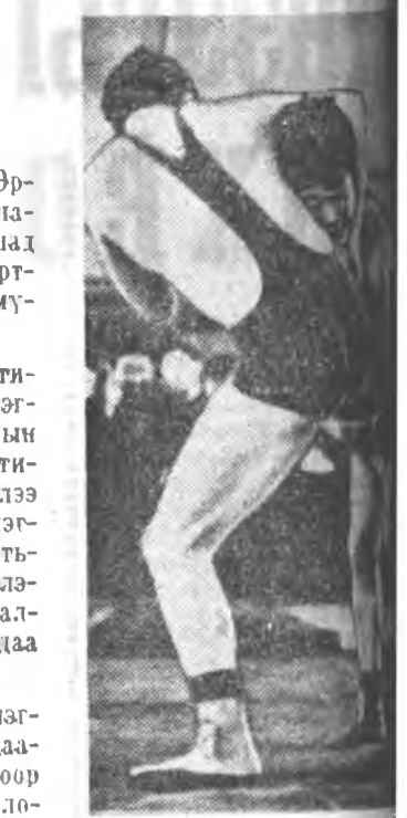
байгаа. Гурбадахи шатан мастер бүхнэ эргэ элээдүүлэе, саашдаа мангуй булчирхаа багтай...