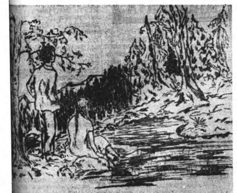
ий аймагай Санагын дунда хургуулин 10-дахы классай Бадмаевагай «Нютагтам хабар ерэ» гэхэн зураг толилоод, шалгалтые һайнаар үгэхыен «Хонх» юрөөнэ.

Хүригшэ үеэнь Хүрдэн шэвээн һүүлтэй, Үндэр дээрэ үлгөөтэй, Убгэн буурал абатай, Яһан хабшаг эжытэй, Ябууд сагаан хубүүтэй.