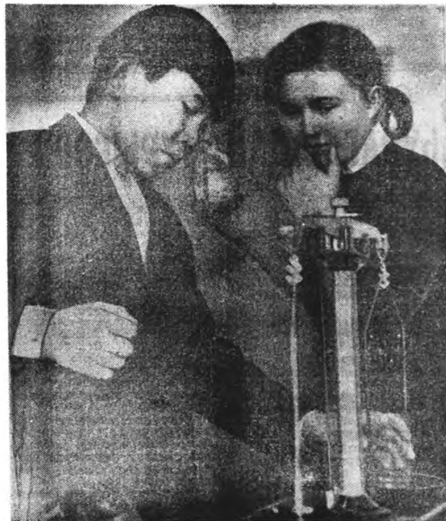
Ерээдүйн шэжэлэгшэд. "Хонхын" хөөрөлдөөн

Харюу хүнэй хэлэн мохоо, Хүгүрһэн хүнэй шүдэн мохоо, Шулуунда элһэн зэмсэг мохоо, Хитүү хүнэй зориг мохоо, Харгыда барагдаһан таха мохоо.