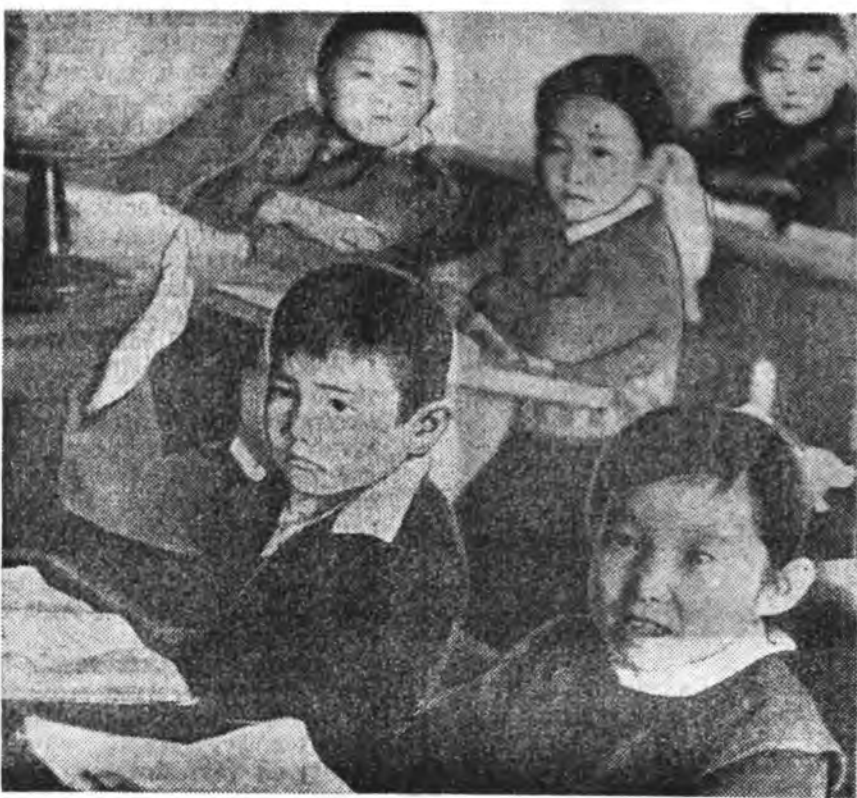
Ильич багшын эдирхэн ашанар.