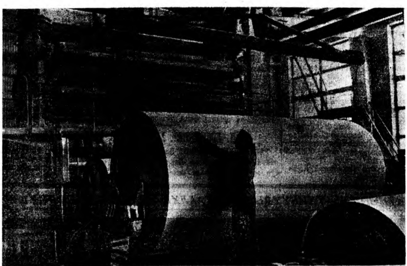
Саарһа гаргадаг Б-21 гэжэ машина Пермскэ саарһанай комбинатад ашаглагдама эхилхээ байна. Энэ комбинат жэл соо 50 мянган тонно саарһа гаргаха юм. Комбинатай хүдэлмэришэд шэнэ машиные найнаар сэгнэнэ.