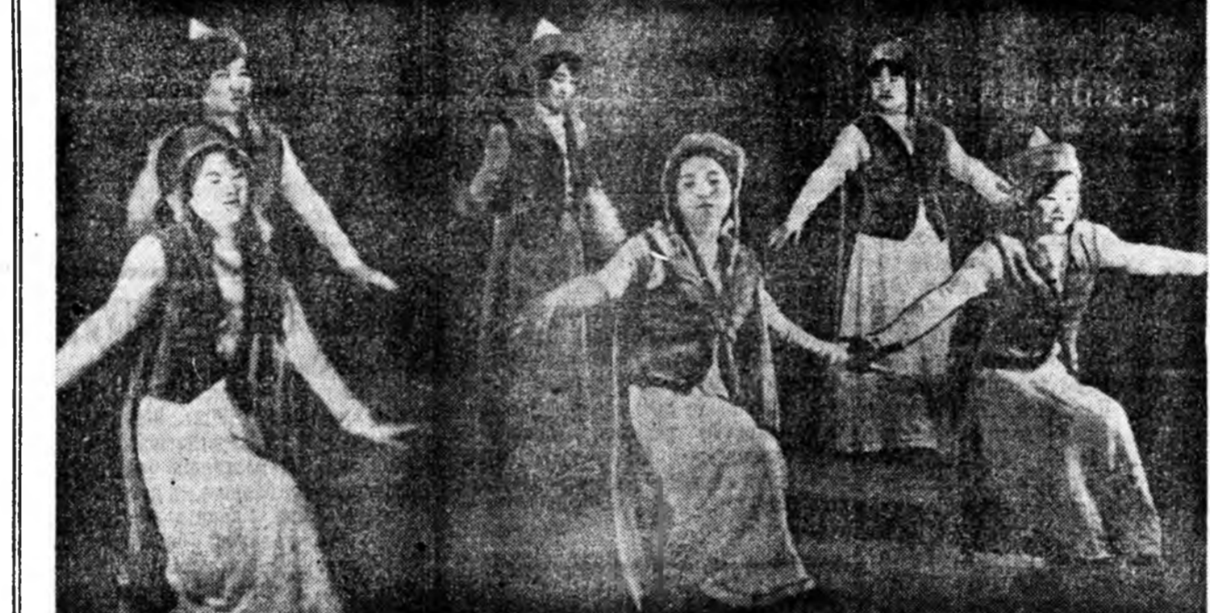
Монголой хуралсалай училишчида эмхидхэгдэнэ уран найханы бүт-гэмдэ хабаадсалсажа, арадайнгаа жэнхэн хатар ваада гүйсэдхэжэ байна.