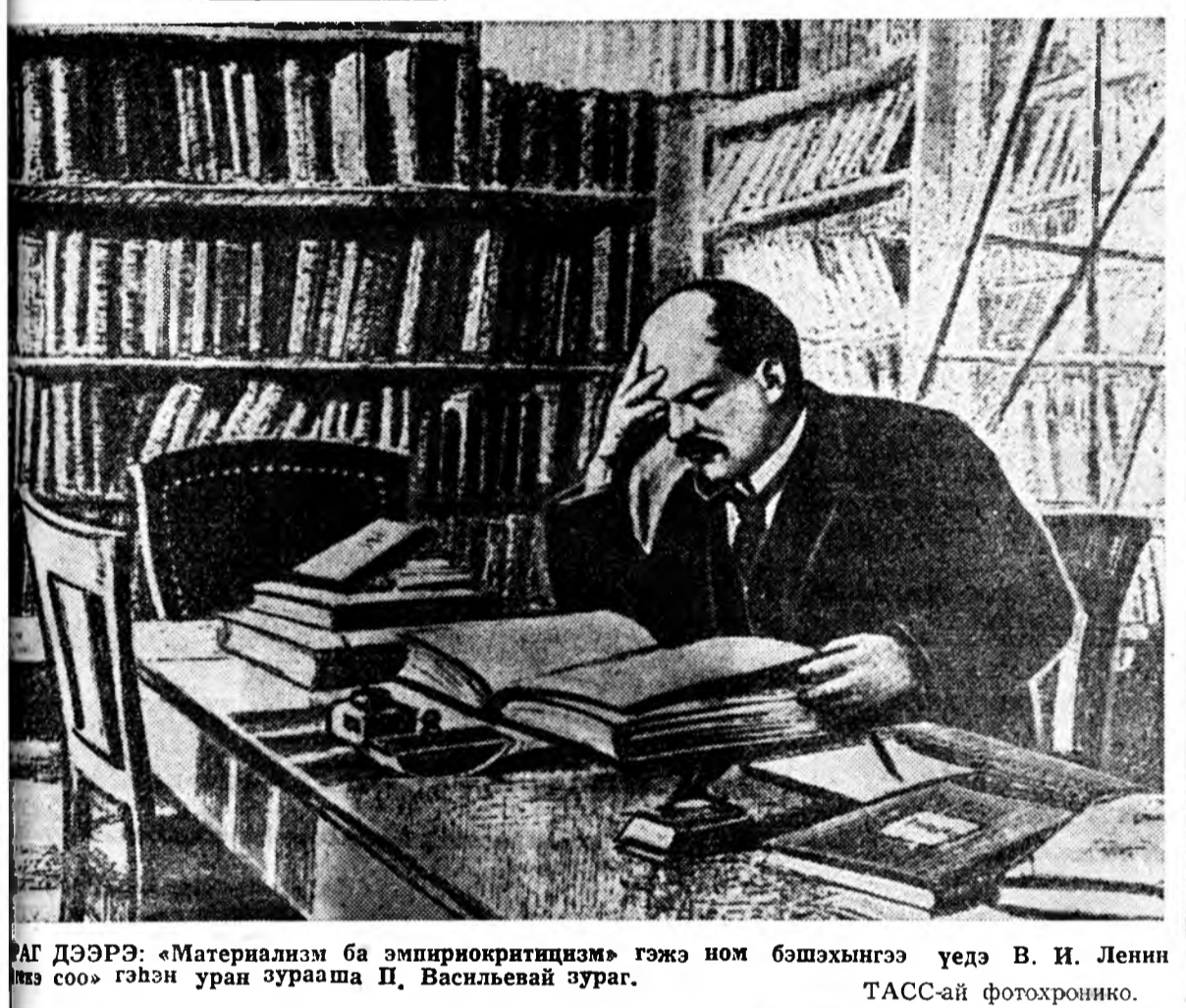
В. И. Ленин бэшэхынгээ үедэ В. И. Ленин.