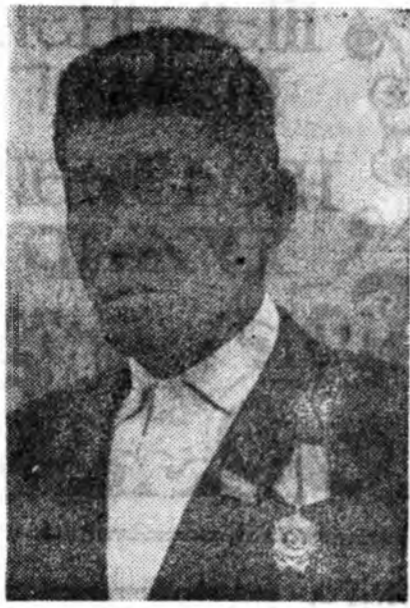
Малдаагийн тэжээлтэй болохонд.

Таряшанай баяр эхэлж байна. Энэ баяр нь манай аймагт үндэсний баяр болж байгаа билээ. Энэ баярын үр дүнд манай аймагт үндэсний баяр болж байна.