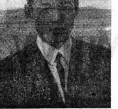
Бидэнэр, хүдөө ажахын хүдэлмэрилгэгчид Бурядайнгаа нийслэл — Улаан-Үдэдэ хэдэн хоног соо айшалажа, найн нуумз харжаа бу...