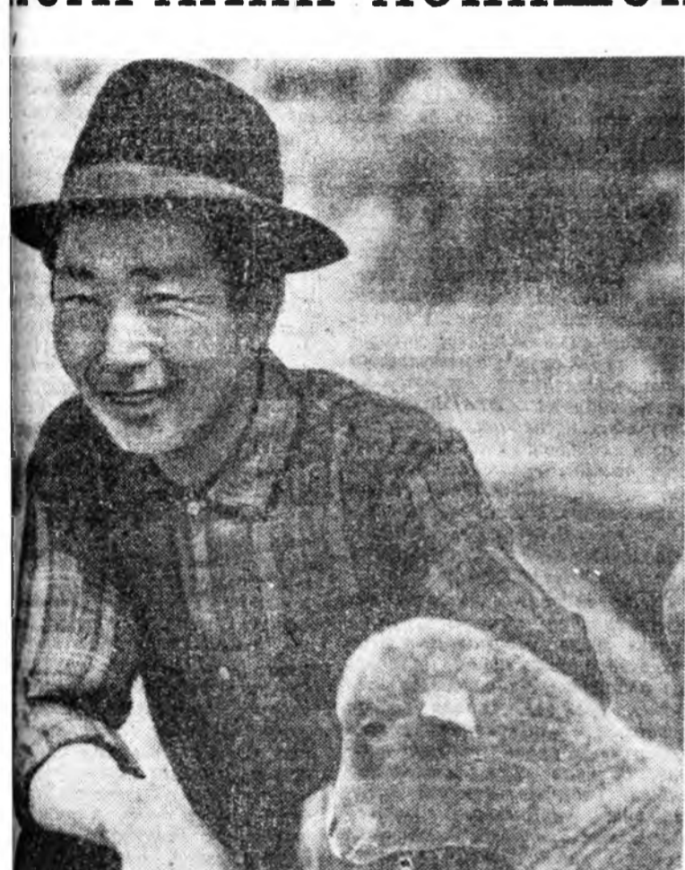
Хонидше бэлтхээрэ ябаруур нурга хонид хушуу...

Хонидше бэлтхээрэ ябаруур нурга хонид хушуу... Энэ баярын үр дүнд манай аймагт үндэсний баяр болж байна.