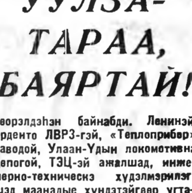
Бидэнэр, хүдөө ажахын хүдэлмэрилгэгчид Бурядайнгаа нийслэл — Улаан-Үдэдэ хэдэн хоног соо айшалажа, найн нуумз харжаа бу...