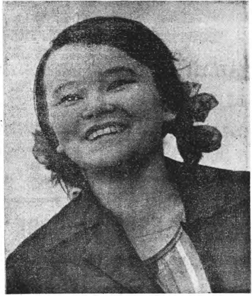
Жаргалтай даа залуу наһан, Жабхалан, нур түгсэхэлэн. Байгаа дэлхэйдэ магтуулһан

Тэжээл бэлэдхэгдэе табаадажа байнхан механизаторнуудые, колхоз-