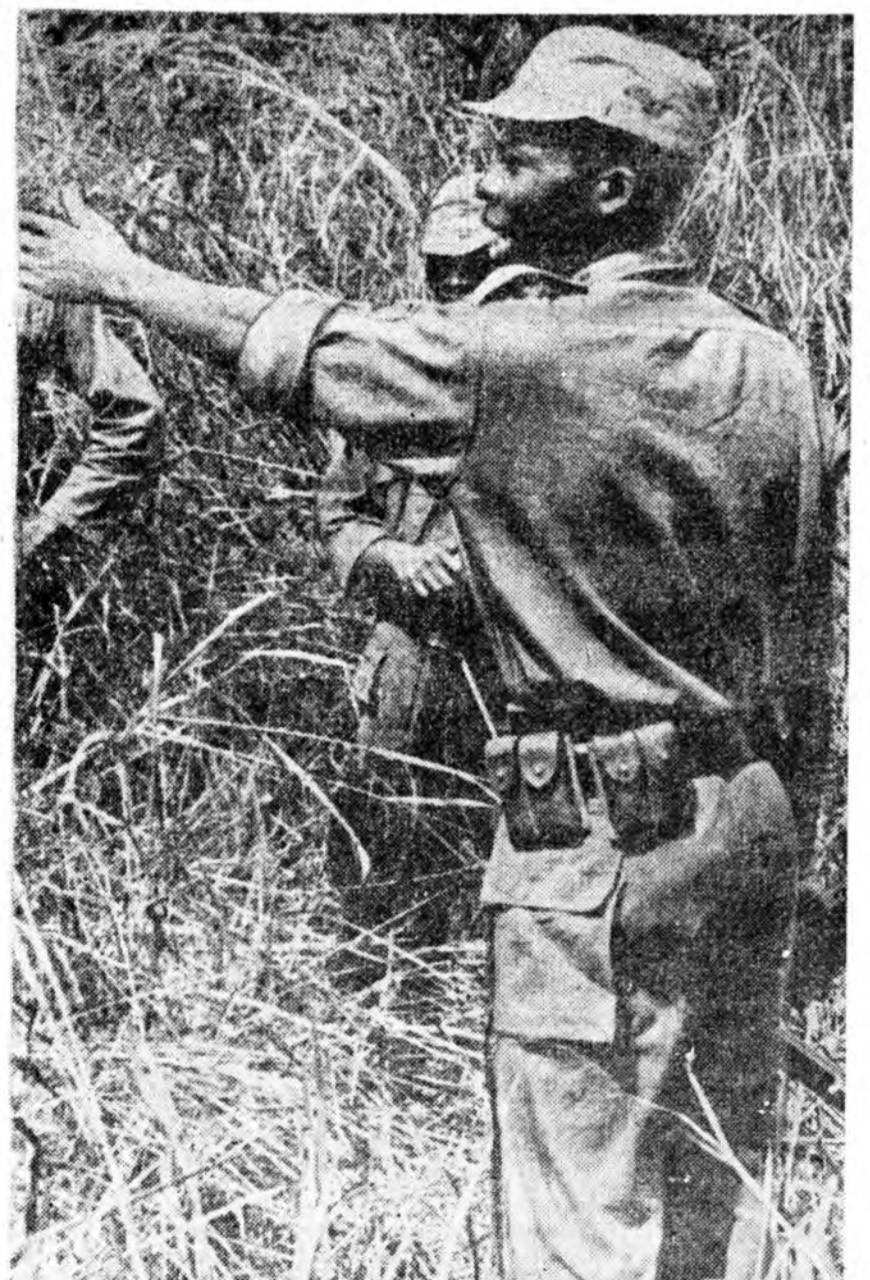
АНГОЛО. Анголыг сүлөөлхн түлсэ тэмсэн бодоһон патриодуудай нэгэ базада энэ зурга буулгагдаа. Португалын колонизаторнуудай урдаһаа Анголын партизандууд хэдэн жэлэй туршада шанга тэмсэл үрэлжэ байна. Ардай хүн сэхэ хүүбэдтэ дэлхэйн үнэн сэтхэ хүн түрэлтэн талархана. ЗУРАГ ДЭЭРЭ: командир захиралта хүбүндэ.

то сэрэгтэй шухала түб байһан юм. Биафрека можонхид тэндэ буу зэбсэг үйлдэбэрлэн гаргадаг байһан. Энэ хотын түлөө тэмсэлэй үелэ Биафрин сэрэгшэд олон хүнөө алуудаа, сэрэгшэ техникэ алдаа гээд сэрэгтэй мэдэн соо мүн лэ заагдана.