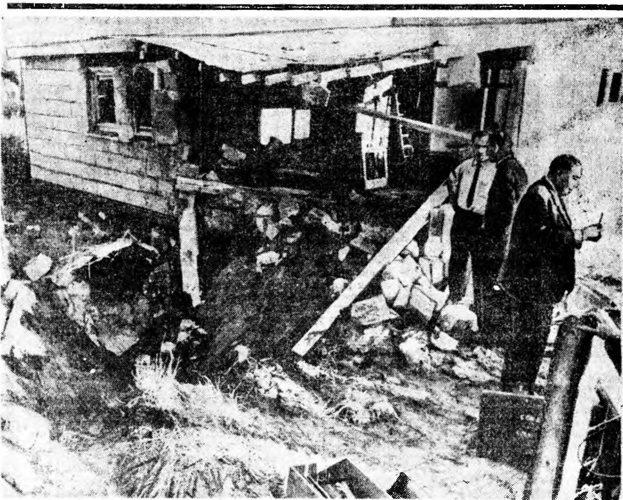
БРИССЕЛЬ. Бельгийн долоон офицерууд-минернууд Остендерн хотодо дайнай үедэ унаһан бомбын абажа байгараа, наһа бараа. Бомбын тэднэрэн ходолон абаха үедэ тэрэн тэһэржэ, бултень хүкөөсө.

Тэхэ хоерой нэрхэ тэхээ ба-рижа, газар дээрэ унагаагад, үүрлэхэ гэжэ байтарнь, хаана-наашеб шаазгай бидэ боло, урса муухан гэрнэй булан дээрэ нуугаад, хүнэй хэлээр ша-ханаба ха.