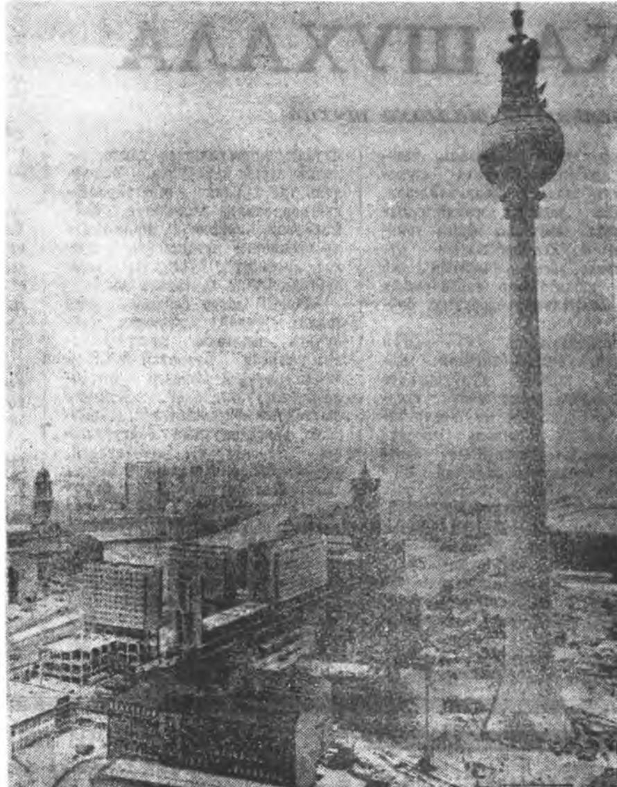
АЛ ДЭЭРЭ: гданьска верфь дээрэ. Берлин хото. Үндэр гэгшын телевизионно башни эндэ ба башни. Республикын хорин жэлэй ой болотор энэ башни