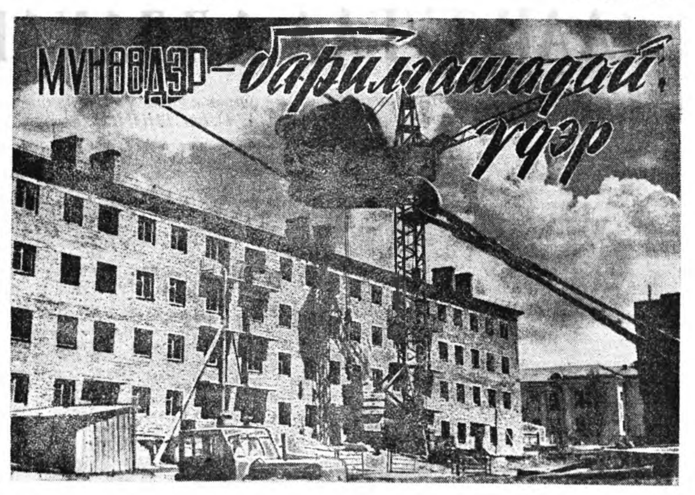
Шулуу нүүршээдэй ажахуудга Гусиноозерск хото үргэдхэдэжэ, гоё байхан, томо гэрнүүдээр шэмэглэгдэжэ байна.