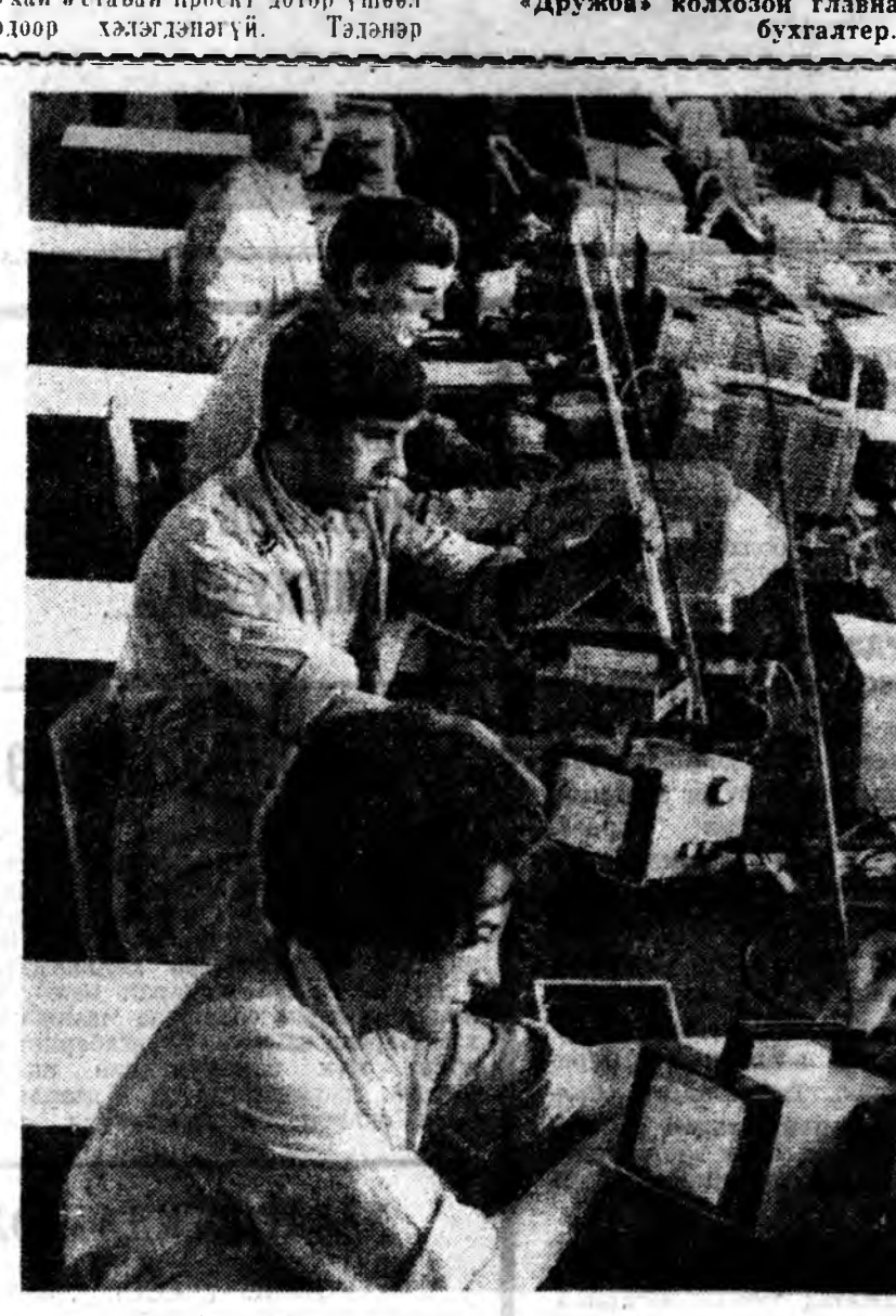
ЛЕНИНГРАД «Электроника ВЛ-100» гэгээн түхэлэй заан телевиорнуудыг «Позитрон» гэжэ нэгдэлдэйлэ бүтээдэг болло. Энэ телевиор 70—100 модоной газарнаа дамжуула абажа шадаха. ЗУРАГ ДЭЭРЭ: шэнэ телевиор хабсарала. ТАСС-ай фото.

Б. САХИЯЕВ. Бэшуурэй аймаг «Дружба» колхозой главна бухгалтер.