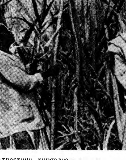
ЧАД РЕСПУБЛИКА. Саахарай тростник хурыалга.