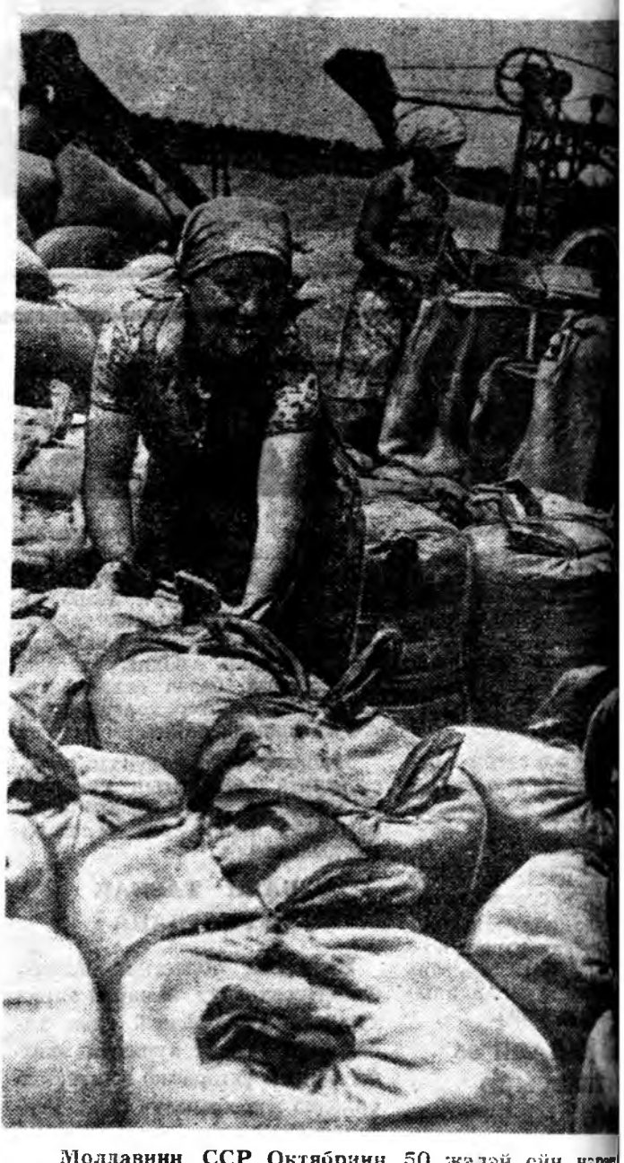
Молдавини ССР. Октябрийн 50 жэлэй ойн нэрэ хозойнд тарягаа хуряжа, сүлөөгүй байна. Энэ хозой механизаторнууд 1,5 мянган гектар газар ярахан. ЗУРАГ ДЭЭРЭ: оныгээр улагдамал тоог дээр даха ороон мэрэгжэлдэнэ.

Семинарта хабаадагшад эндо нэгдэнэ Ленинскэ музейн экспонатунуудай танилса, машинизаторнуудай агитаторнуудай хөрөндөхөдөн байлса. Энэ халуун халда политическэ ба соёл хүдэлмэри һайнар эмхилхэхэдэн Сорокинско районий дүй дүршэл туналха байха. (ТАСС).