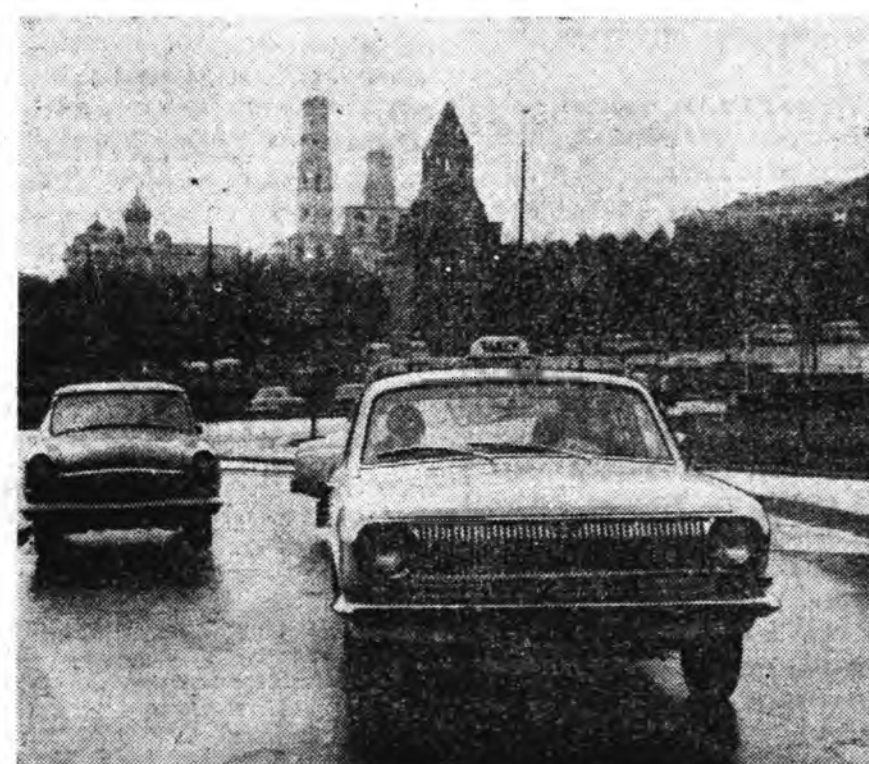
Москва. Нислэл хотын үйл-сэ гудамжануудаар «такси» гэр-нэс бэшгэтэй шэнэ автомобиль-нууд гүйдэдэг болоо. Энэ ха-даа Горький хотын автомо-бил бүтээгшэдэй хэһэн шэнэ «Волго» машина болоно.

Газаа түхэлээрөө гоё зохид машиные москвагайхид най-хашаан харана.