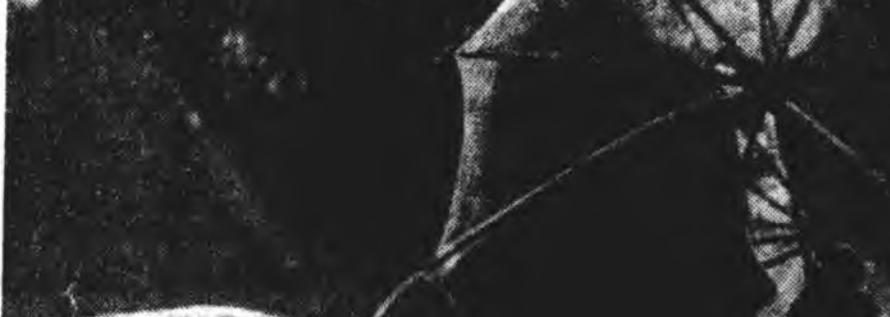
Нэбшээхэн нэмээхэн нэльбэдш онгосымнай! Аргаахан гитарахан, Аялгалыш дурымнай...

гэхэ мэтые ходо гаргажа байгаа һаа, ехэл һайн нэи. Би шүлэг уншаха ехэ дуратайб.