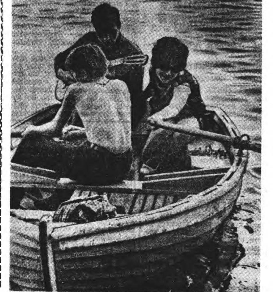
Нэбшээхэн нэмээхэн нэльбэдш онгосымнай! Аргаахан гитарахан, Аялгалыш дурымнай...