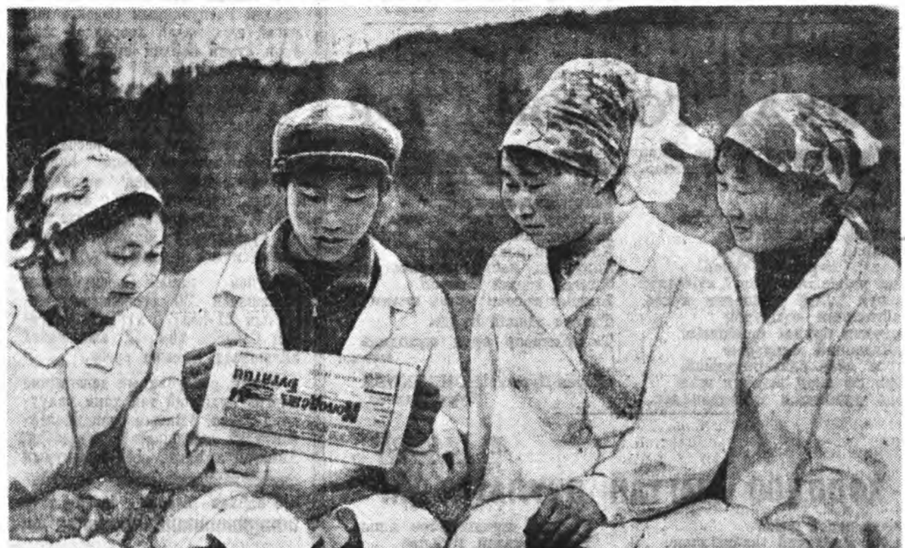
ЗУРАГ ДЭЭРЭ: Захаминай аймаг «Победа» колхозой комсомол-залуушуулай һу...