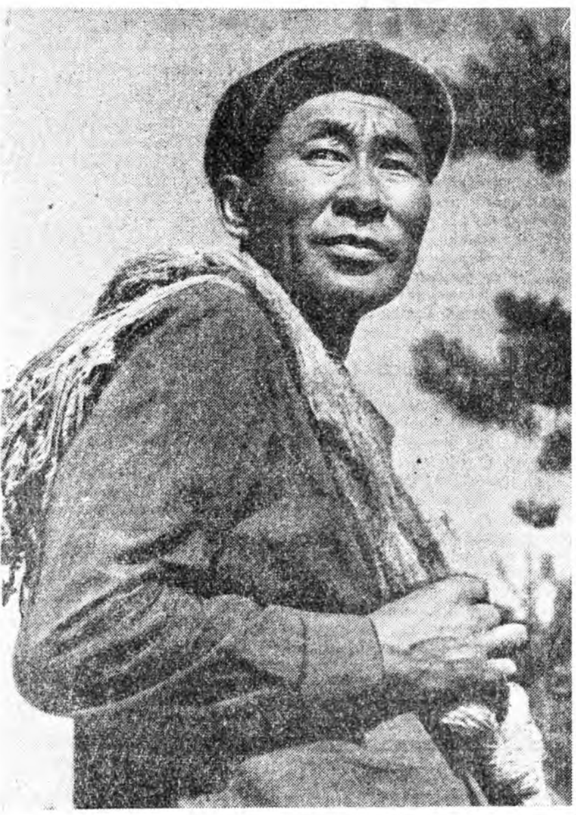
Гавриил загашанидзе Калитиний нэрэмжэтэ...