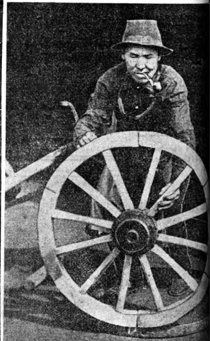
Гэбешы тэргэ, шаргамнай өөрынгөө нангян гэгээр эаб даа. Тарья хуряалгын халуун халт Молдон мөөртэ морин тэргэмнай үшөөл хэрэгтэй...