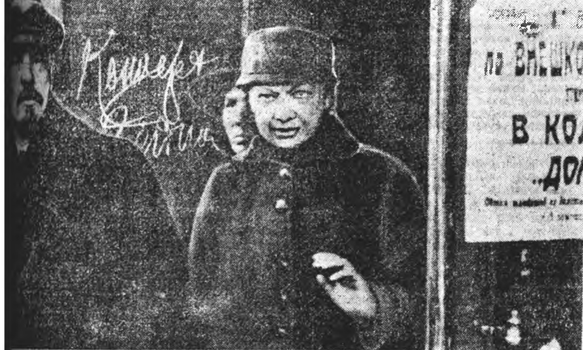
Н. К. Крупская хоёр Союзудай байшанаа гаража ябана. (Москва 1919 оной майн 6.)

Ленин Измайловска полкын урда үгэ хэлэбэ. Апрельин 15-дэ «Солдатская правда» гэжэ газетэ гаргаа эхилэ. Харин 16-дэ Петроград солдот болон матросууд Ленин болон болшвиговууде мурдэх» гүрдэхэ ябадалые буруушаан жагсаал эмхидхэбэ. Апрелин 18-дэ (майн 1-дэ) Россия хэзээшье урдан үзэгдөгүй, майн 1-нэй асарн эхэ жагсаалууд бүхнэ орон дотор болоо нэн. Мүн апрелин 18-да гададын хэрэгүүдэй министр Милков Саг зуурын правительствын зүгнөө томо толило, боложо байгаа даие илалта хүртээр үргэлжлүүлэхдэ, союзнигуудай үмэнэ абahan ялгаа дүүргэхдэ гэжэ сонсохоко. Энэнь хадаа П. Н. Николаин правительствын, хаанай бүхнэ шанигн зүгнөө буржуазин үмэнэ абahan уулганууд байха гэжэ болшвиговууд шүүмжлэн хэлэлдэ бэшэбэ. Олонингэ зон энэинишье ойлгон гэхэдэ, үйлсэдэ гараба. Апрельин 21-дэ тэдээр Невск проспект дээрэ жагсаал хэбэ. Мүн Саг зуурын правительствын тала баригшадше баһа тэндэ сулгараа нэн. Эдэ бүхнэ хэрэгүүд болшвиговуудэ жагсаан нэгдэхэбэ. Петроград болшвики эмхидхүүл Лениний үздэ даһан шинхээршүүдэе абаа нэн. Апрелин 21, 22-то ЦК-гай абahan шийдээршүүд со Саг зуурын правительствэ элишлэхэ шухала гэжэ бэшгэдэн, мүн Петроградтай Советэй эбсалгын тактика буруушагдаһа, Саг зуурын правительствэ дары унагааха гэжн нэдэлгэ буруу гэжэ хэлэгдэн юм. (Үргэлжэлэмэй хожом гарха). (АПН).