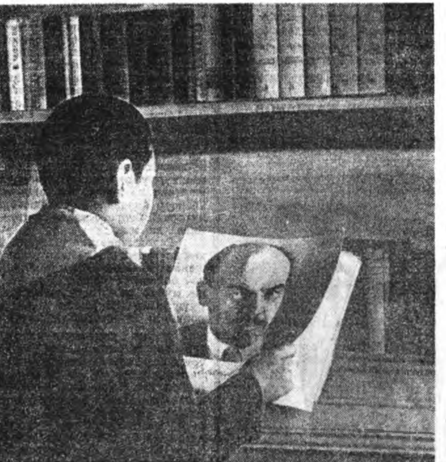
Мухар-Шэбэр, аймагай предриятинуудта партина эхин организаацинуудай тоосоото-хуи...

Партида ороһон үлдэй дунда, мүн ажалай түрүүшүүдэй дунда хүмүүжүүлгын хүдэлмэри ямарар эмхидхэгдэһи гэжэ партинын райком сэг үргэжэжэ һонирхоно.