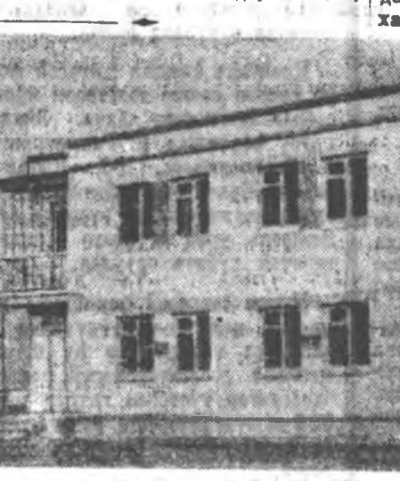
ЗУРАГ ДЭЭРЭ: Татарай АССР-эй Високогорскэ районхой «Серп и Молот» колхоздо барилдан хоёр кварталтай хоёр даһар гэр.

Тинимэһе саһамада колхозуудай түб тосконууды шэнээр бариха, городской тухэлтэй болгоходо, Татарай АССР-тэ хөгдөжэ байһандал адиар хэжэ шухала гэжэ ханагдана. Энэһэнэ гансахан колхоз өөһада хэжэ гэгдэ найдад һуухагүй, тэрэнине республикын хэдэ органуудай хиналта, хүтөлбөригэ дор абаха.