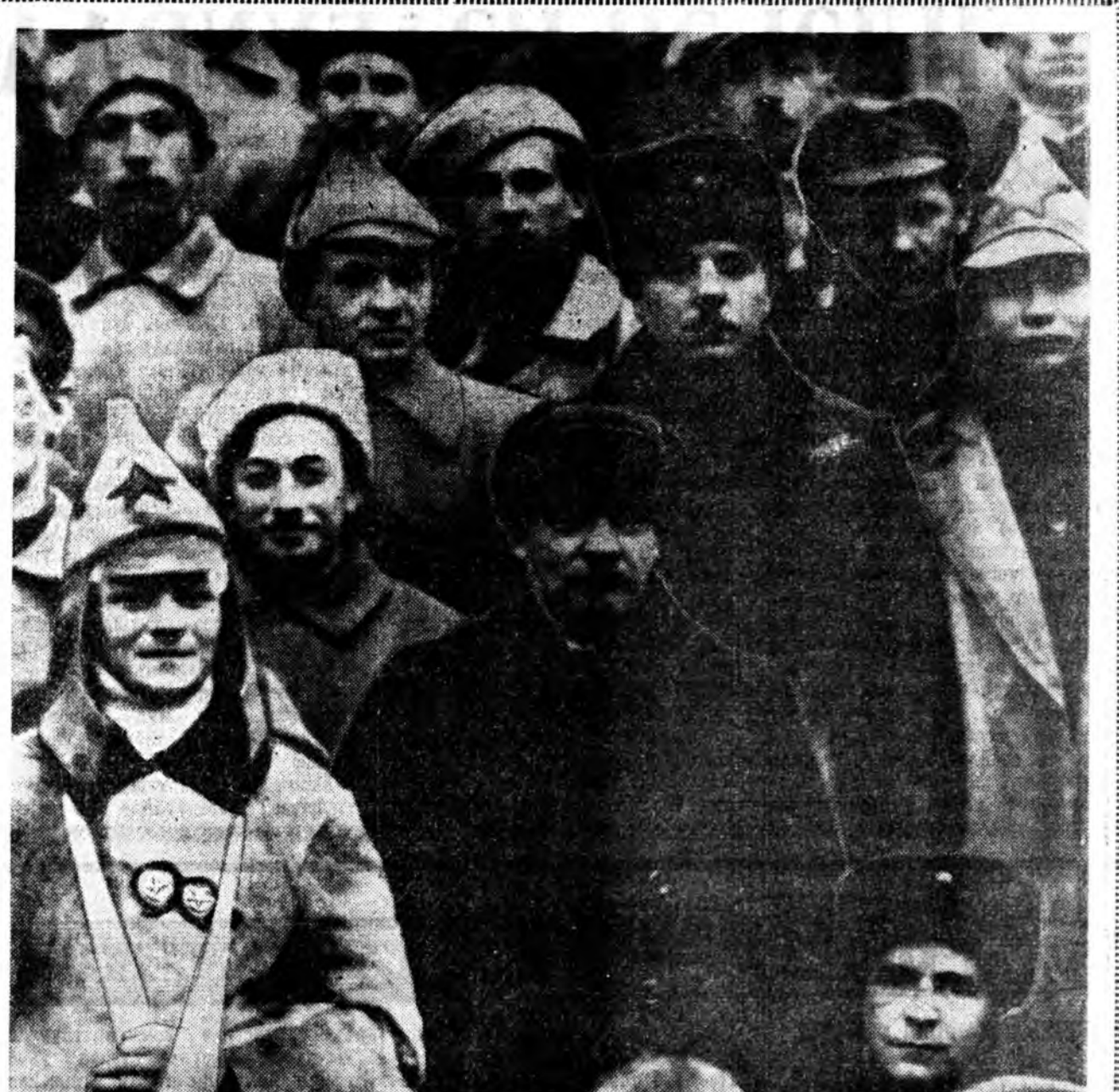
В. И. Ленин, К. Е. Ворошилов РКП(б)-гэй X съездын бүлэг делегадууд — Кроунштадта буһал-гаашадые даралгада хабаадагшад дунда. ТАСС-ай фотохронико.

КАРАЧИ. (ТАСС). В. И. Лениний тэрээр 100 жэлэй ойн найдурлэхын тула Зуун Пакистанда эмхидхэгдэн тусхай комитет энэ үдэрт зориулагдан баяр ёһолол эмхидхэхэ тухай шиндхэбэри Дакка хотодо бталада. Найдурлэхын январин 3-да эхилэхэ юм. Ороной нийтин политическэ элитэ ажал ябуулагшад энэ үдэр В. И. Ленин тухай элихэлнүүды хэбэ. Гэхэтэй хамта В. И. Лениний ажабайдал ба ажал ябуулгы шудалха семинарууд худалчиршэжэ эхилэхэ.