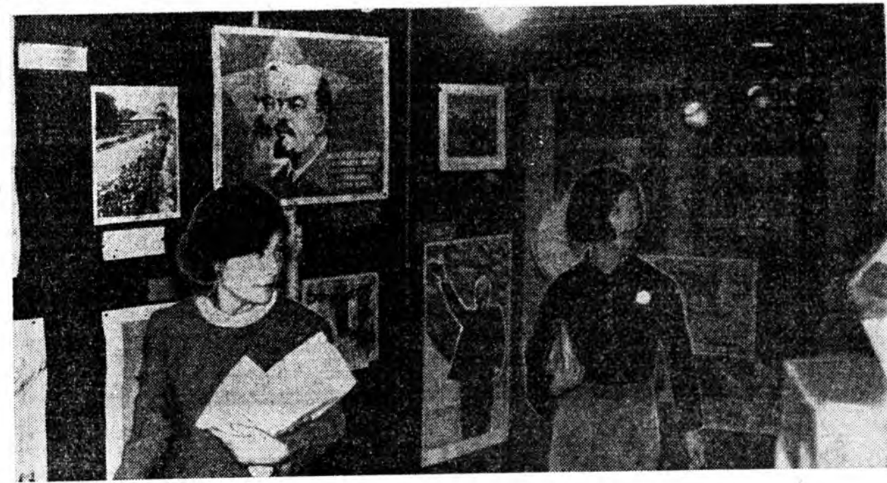
ТОКИО. В. И. Лениней түрөөһөр 100 жэлэй ойдо зорюулагдаһан хэдэн хэмжээ ябууланууды Японой демократическа эмхитгүүд оронойнгоо нилсэлд хото болон бусад городуудта үнгэргэжэ байна. Токиогой Сибуйа райондо энэ алдарт һайндэртэ зорюулагдаһан совет уран зураашадай бүтээлүүдтэй выставк нээгдэ. Тэрэнине Японой социалист партини дэргэдэхэ гадаадын гүрэнүүдтэй соёл культурын хани барисаа байгуулаха Ассоциаци эмхидхэнэ байна. Энэ выставкдэ Япондо хэблэгдэн В. И. Лениней зохёолнууд мун лэ табигдаа.