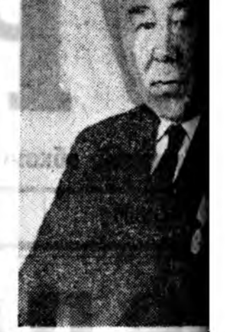
Тэрэ ханаанда оруула хайлажа һууба.

Зоотехнигий досоо буруутгажа, хонишон эхэнэрэ яһалашье зэмлээ, улайлгаа сайлгаашье. Тинхэдэ дутуу дундануудаа хийшан гээд түргэн усдаха тухайн томоотой язаар тоб байса хэлжэ үгөөд, һүүлдэнь. — Угтоодор шамда байхан үбһэ трактораар асарха байха. Тэрэнь эхэл нарилжа эдөөлээрэй. Тинхэдэ дархашуулые элгээхэб. Өөрөө заажа, хамаг нүхэ һүбөнүүдэ бэлтгэһэн бүтүүлүүдэд, дулаалуулад табарай. Зүгөөр хурьгадаа өөрөө гэмээр гараалуула болоо һаа, хароусаха саг эрхэ гэжэ бурмарайрты, — гэхэдэнь, хонишон эхэнэр, тэрэнэй туһалаша тэрэ элгээшье сэжэнигээ өбортө бүүхөөр лэ хадужа абайхан банха.