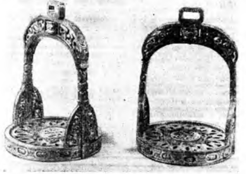
Мун Монгодоо суутан Галсан гэжэ һилүүршэ дарханан урлал бүтээһэн дүрөө Зүүн зүгэй арадуудай искусствын Москвадахи музейд табигданхай.