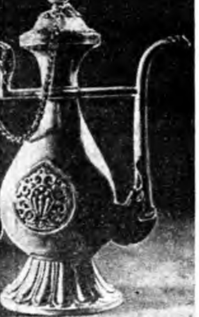
Монголой уран һилүүршэн Тожил гэһын дарханлан мунгэн домо Улаан-Баатарай түб музейдэ орогтод хайхашан харадаг юм.

Монгодо мүнөө үедэ арадай урлалы шэнжэлэн үзэхэ хэрэгтэ ёһотой анхрал хандуулагдажа эхилэ. Монголой «Түмэн жаргалан» гэгэ угалзануудыг шэнжэлхэ, тэрэниие олоной дунда нэгтэрүүлхэ хэрэгтэ суута уран зурааша Манибадар (1889—1963) эхэ юмэ хээ. Хуушанай зурааша. Үгэрэнэй шантай лауреат Манибадар бага наһанһаа арадай угалза шэмгэлдэй гоё хайханыне зохидоог, өөрөө зурадаг байһан юм ааба. Урдан Монгол оройной юрын арадай үхибүүд дасанай хургуулида һурагал аргагай һэн. Тиймэһээ Манибадарын гэртэһин хууруугэ хубарга