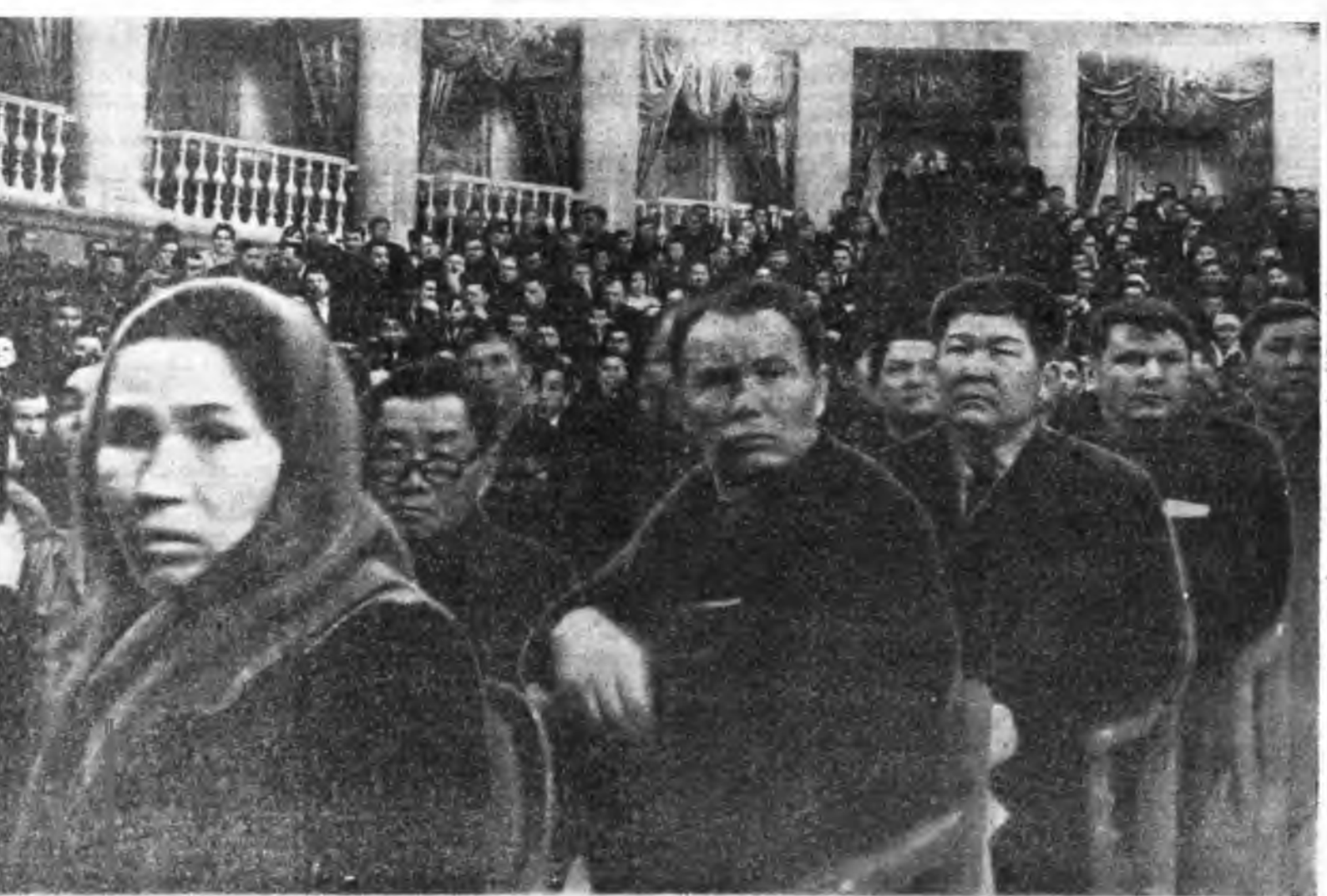
1970 оной январин 24-дэ үнгэрэн республикын хүдөө ажахын түрүүшүүлэй зүблөөнэй хүүлээр колхозуудай түлөөлгөшэдэй суглаан болоо. Тэндэ колхозуудай хэрэг эрхлэхэ республикын Совет 56 хүнөө һунгагдаа. Советэй түрүүлгөшээр республикын хүдөө ажахын министр Л. В. ВЛАСОВ, орлогшоннуудаар—Бэшүүрэй аймагай «Дружба» колхозой түрүүлгөшэ Н. Б. ЮМСУНОВ, Түнхэнэй аймагай «Сибиряк» колхозон түрүүлгөшэ Л. А. МАКСИМОВ һунгадһан байна.

Дээрэ дурсагдаһан отарануудта ажаллаһинд автолава оройдошье ябадаггүй, соёл культурыннай худалмэришад бизнээс мартаһай гэдэ нэгэн дор мэдүүжэ хэн. Тинхэдэ хонирхолтой лекци, хөөрөлдөнүүд оройдошье болодоггүй шахуу байла. — Сай, тамхи абахын тула ааар хэдэн километрэ оршодог Хужар тос