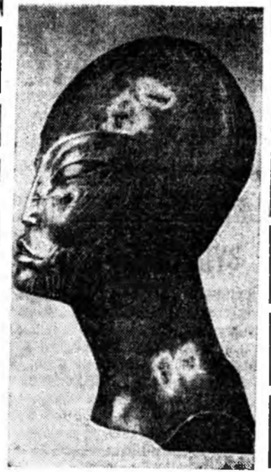
МОДОН «БУДАМШУУ» — МОСКВАГАЙ АЙЛШАН

Хэлхээ холбооной худалмэрилгэснэ республикискаа суглаан хилхан боложо, тэндэ 1969 ондо хэргэжэн худалмэрин дүн болон байша ондо бөөлүүлэгдэхэ харгаа тусай тухай асуудал зүбшэн хэлсэгдэнэ байна.