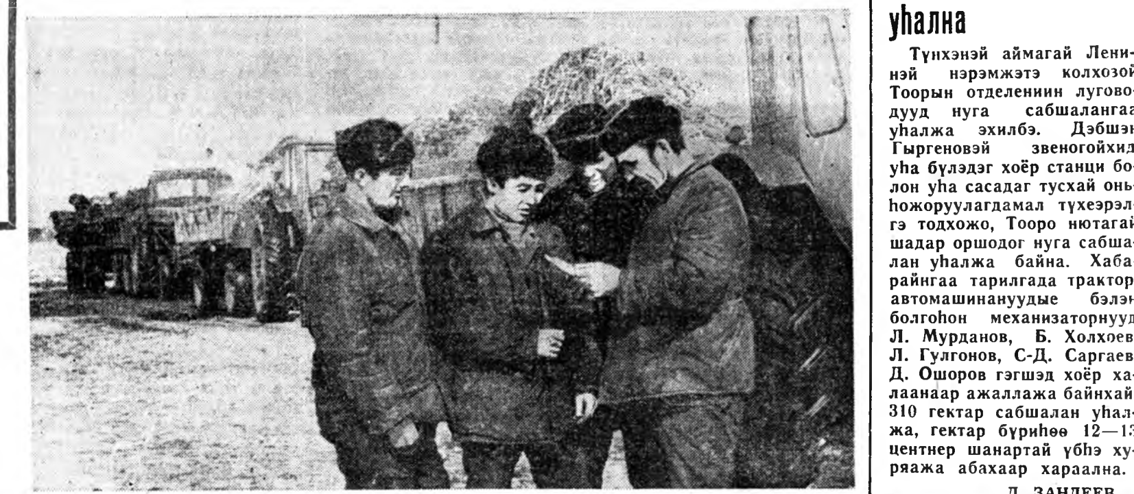
Нуга, сабшаланга аа уялна

В. И. Лениной түрнөөр 100 жэлэй ойдо зориулалан СССР-эй ардадуудай искусствунуудай найр-